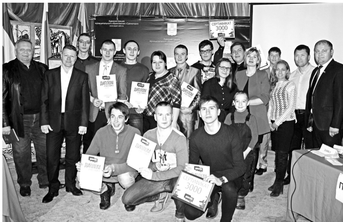
Участники и организаторы дебатов. Победа - одна на всех...

и католическая. Воспрянув из руин после Второй мировой войны, храм используется ныне в качестве концертного зала.