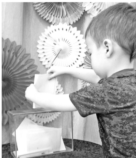
Маленький избиратель делает свой выбор

Претендентов на пост главы было несколько: Кощей Бессмертный, Баба Яга, Мальвина и Илья Муромец. Каждый