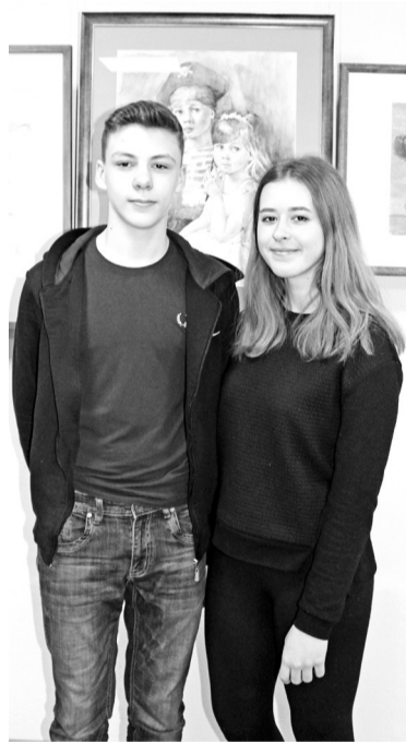
Окунуться в творчество - всегда огромное счастье

В 2017 году ДХШ «Колорит» вошла в число 50-ти лучших школ искусств России.