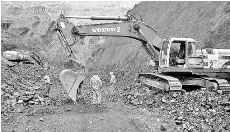
На разрезе «Майрыхский» кипит работа

В рамках подписанного в конце прошлого года соглашения между Правительством Республики Хакасия и ООО «Коулстар» - новым собственником разреза «Майрыхский», задекларирован доход за 2017 год одного из учредителей как физического лица, который поступит в бюджеты Республики Хакасия и города Абакана.