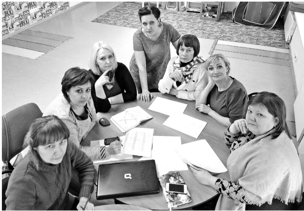
Оргкомитет за работой

- Лично для меня форум интересен как возможность привлечения внима-