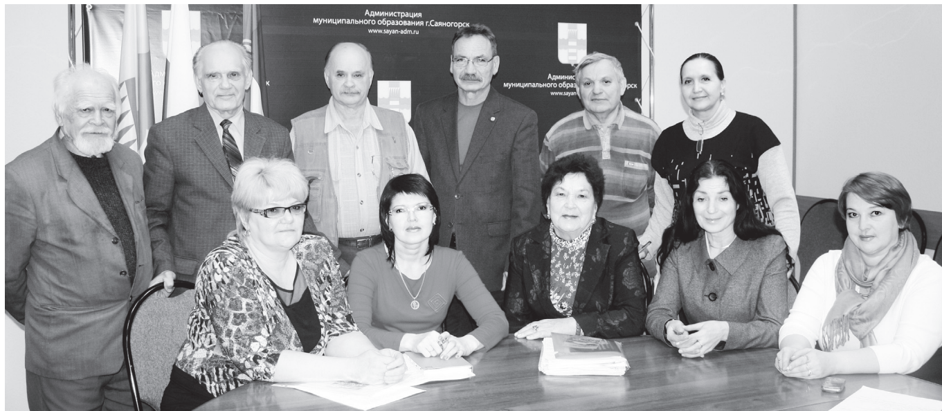
Фото на память...