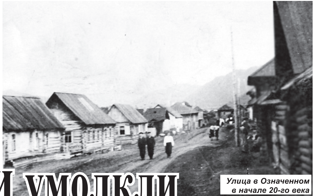
Улица в Означенном в начале 20-го века