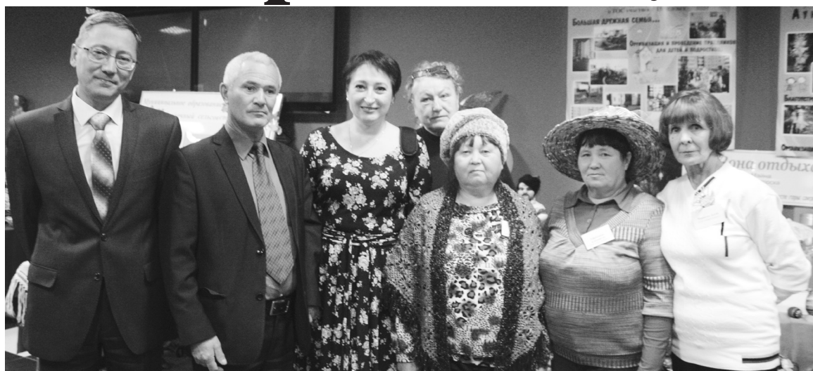
Саяногорцы с министром национальной и территориальной политики РХ Дмитрием Тодышевым (первый слева)