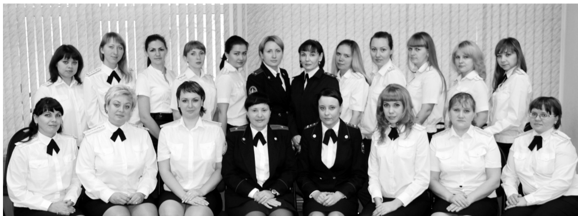
Коллектив Саяногорского городского отдела судебных приставов

Действительно, спрос велик и работы – целый вал. Для сведения: в месяц на одного пристава-исполнителя приходится до 1200 исполнительных документов. Рабочего дня, как правило, не хватает, но никто не считает с личным временем. На такую самоотдачу стимулируют добросовестность