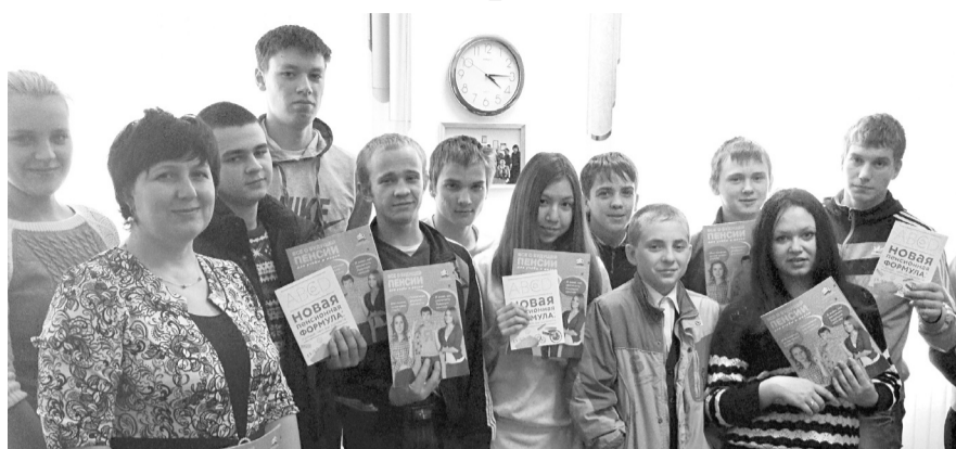
Десятиклассники школы №1 г. Саяногорска в Пенсионном фонде