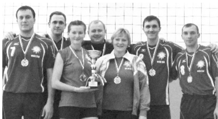
Команда победителей - волейболистов ХП МЭС

Фестиваль работающей молодежи Саяногорска стартовал в минувшие выходные – 25-26 октября. Семь команд-участниц померились силами в плавании и волейболе. Соревнования проходили в ФСК «Черемушки».