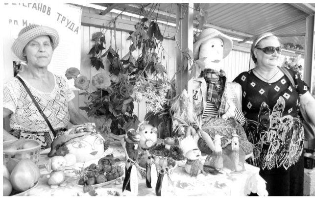
Выращено руками ветеранов труда

И все же... В этом году хозяином выставки