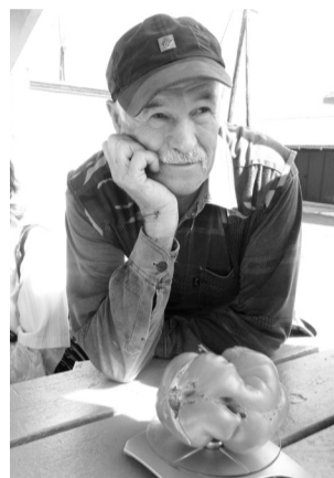
К конкурсу готов

является сеньор Помидор. Ему - отдельные почет и слава, потому как в честь спелого томата даже ввели новую номинацию «Самый крупный помидор». Компетентное жюри пришлось с весами