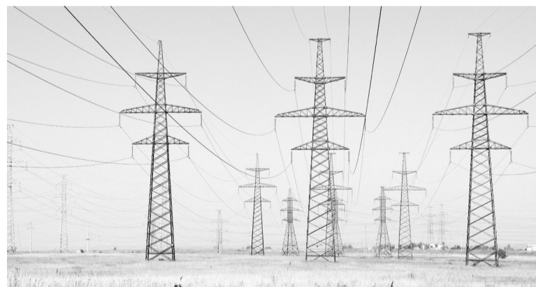
Территория, прилегающая к ЛЭП 220-500 кВ на расстоянии от крайних проводов 25-30 метров, называется охранной зоной линий электропередачи

Ежегодно районы Хакасии охватывают пожары, наносящие непоправимый ущерб. Через эти районы проходят высоковольтные ЛЭП, обеспечивающие пострадавшие территории энергией и транзиты в Красноярский край. Огонь, полыхающий в лесах и степях, становится причиной отключения ЛЭП. Только благодаря высокопрофессиональной и слаженной работе энергетиков удается избежать ограничения потребителей в подаче элек-