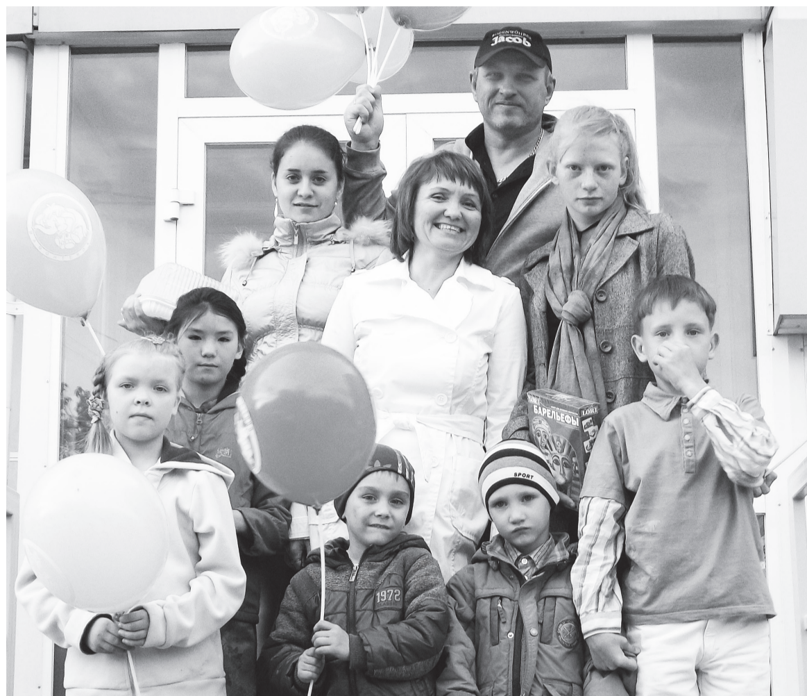
Счастье, когда рядом мамочка и папа

В это время семья жила в съемном жилье, но ребенка им все-таки дали. В детском доме к Ирине привели двух мальчишек: темненького раз-