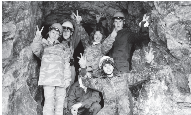
Вышли из штольни Туимского провала

В Саяногорском политехническом техникуме (СПТ) реализуется республиканский проект по профилактике асоциальных явлений в молодежной среде «Тропой предков»