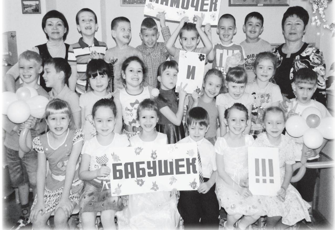
Воспитанники детсада №21 «Аленький цветочек»

Коллектив МБДОУ № 21 «Аленький цветочек» поздравляет мамочек и бабушек нашего города с праздником!