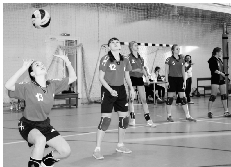
Разминка перед стартом

Десять лет назад по инициативе спортсменов-активистов