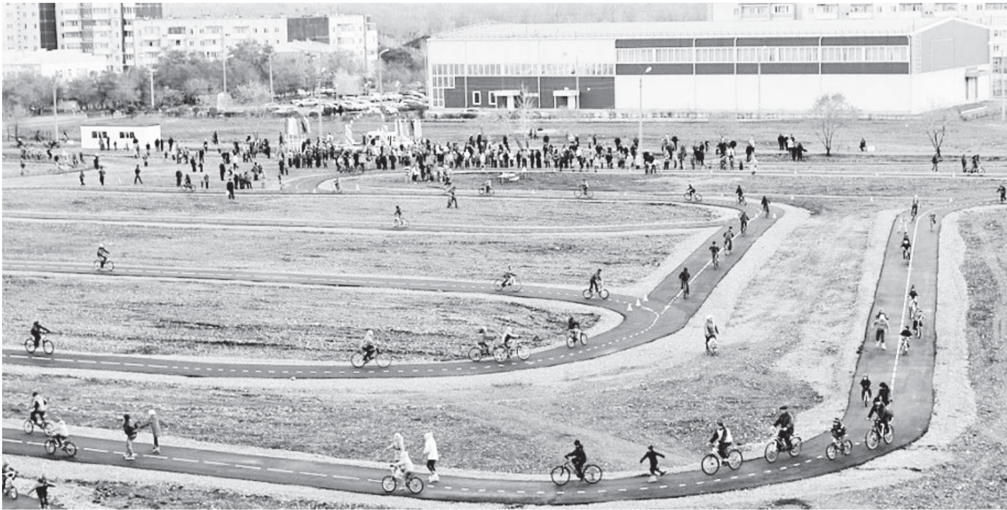
Проект «Саяногорск выбирает спорт»

Сроки проведения конкурса: 17 ноября – 5 декабря 2014 года. Прием заявок на участие проводится до 18 часов по Красноярскому времени 5 декабря по электронному адресу kenig@fcsr.ru . Информация об условиях проведения конкурса, отбора участников, а также номинациях размещена на сайте: http://rusal.ru/development/social_investment/pomogatprosto.aspx