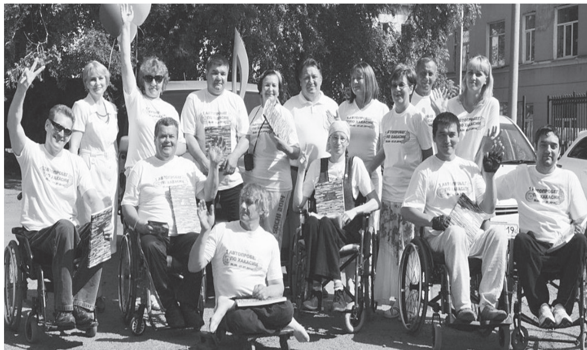
Участники автопробега по Хакасии

- Действительно, термин «доступная среда» приме-