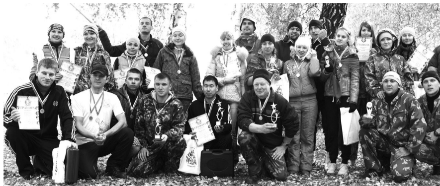
Эмоций хватит на весь год!

Самой шустрой и безупречно преодолевшей все трудности и препятствия трассы стала команда сотрудников налоговой службы «Чемпионы». Они поднялись на первую ступеньку туристического пьедестала. Команда «Русский дух» СКД «Визит» по поселку