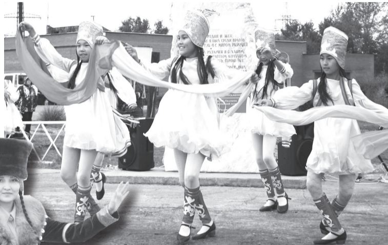
Блестает талантами ансамбль «Ынырхас»

В начале третьего тысячелетия в Хакасии появился новый национальный республиканский праздник – День тюркской письменности и культуры. Так постановил 22 июня 2004 года Верховный Совет Республики Хакасия. Общероссийское и мировое значение данного решения еще предстоит оценить историкам, но уже сегодня ясно, что этот праздник стоит в центре огромной работы по