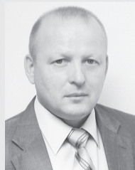
Леоид БЫКОВ, Глава МО г. Саяногорск

Уважаемые педагоги, родители, воспитанники! От всей души поздравляю вас с 30-летием лица «Эврика» и центра развития ребенка - детского сада «Малыш».