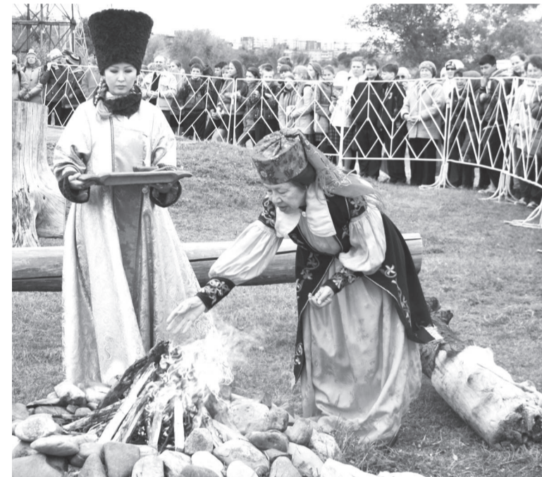
Кормление хозяйки Огня От Ине

И день открытия декадника тюркской письменности и культуры в далеком уже 2004 году был выбран не случайно: третья пятница первого осеннего месяца, близкая к 22 сентября – Дню осеннего равноденствия. По тюркской традиции, это самое лучшее время для проведения праздника, когда вместе с дымом костров возносятся