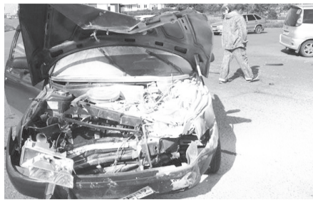
Судя по повреждениям транспортных средств, последствия могли

В результате столкновения рулевой отечественного авто повредил колено, а женщина получила ушиб грудины. От госпитализации они отказались.