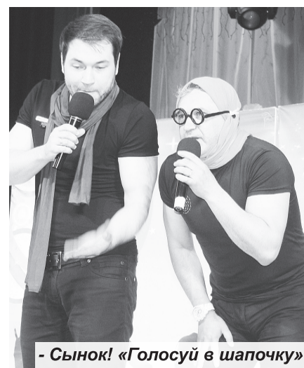
- Сынок! «Голосуй в шапочку»