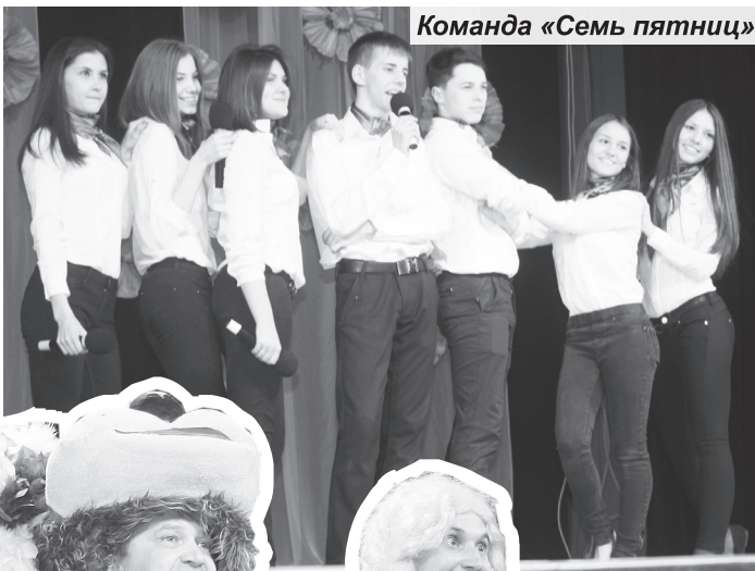
Команда «Семь пятниц»