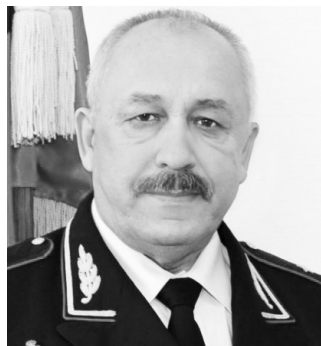
Уважаемые участники дорожного движения!

Обратиться к вам заставляет непростая обстановка, характеризующая состояние безопасности дорожного движения на дорогах нашего региона. Практически не бывает дня, чтобы ни приходили печальные сообщения с автодорог. С января по