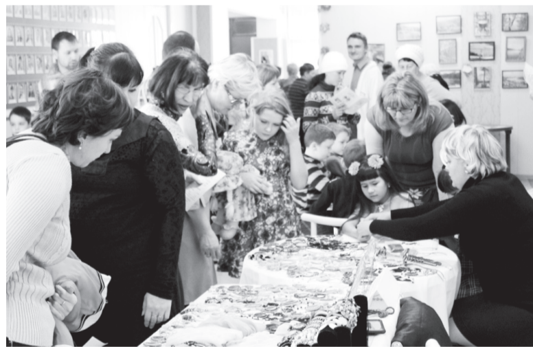
Мастер-класс по бисероплетению