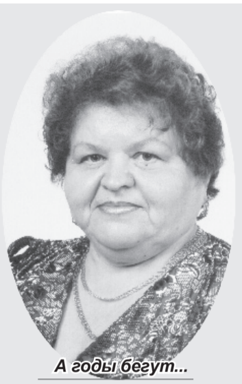
А годы бегут...

Около 39 лет назад на берегу могучего Енисея появился город, нареченный Саяногорском. Он быстро развивался и рос. Сегодня при виде взметнувшихся ввысь многоэтажек с трудом верится, что несколько десятков лет назад здесь привольно шептались степные травы, окутанные серой завесой пыли от идущего впереди транспорта. И как здорово, что есть очевидцы того беспокойного, кипучего, наполненного строительными решениями времени.