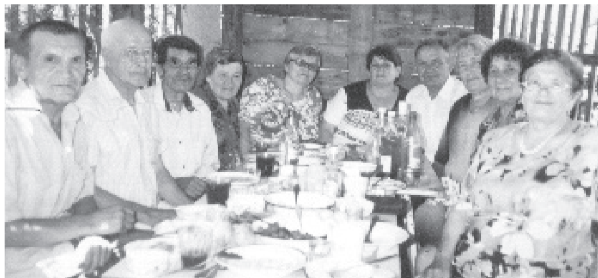
И сегодня вместе

Встреча бригад при асфальтировании дороги «Абакан-Означенное» произошла на Лукьяновской горе