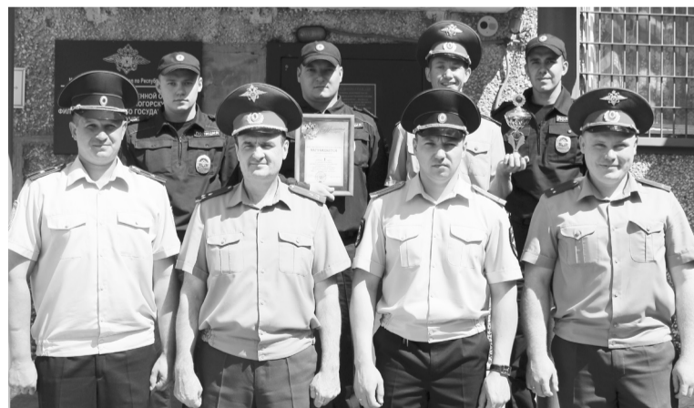
Коллектив ОВО по г.Саяногорску

С начала года на пульт централизованной охраны ОВО по г.Саяногорску поступило с ох-