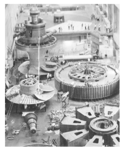
Идет сборка узлов гидроагрегатов