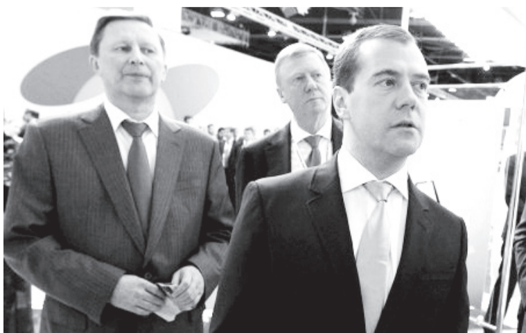
Дмитрий Медведев на форуме

- Провокационное название форума в этом году задает во многом вектор нашей деятельности. Если мы говорим о разрушении, то в первую очередь необходимо разрушить наши стереотипы о том, что мы толь-