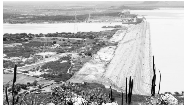
Собрадинью (водохранилище) на реке Сан-Франсиску