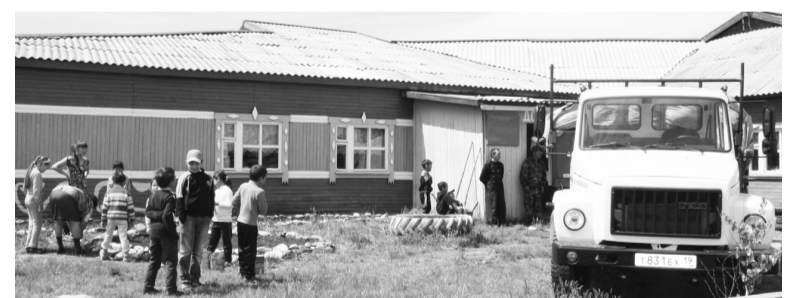
Гуманитарный груз доставлен по назначению