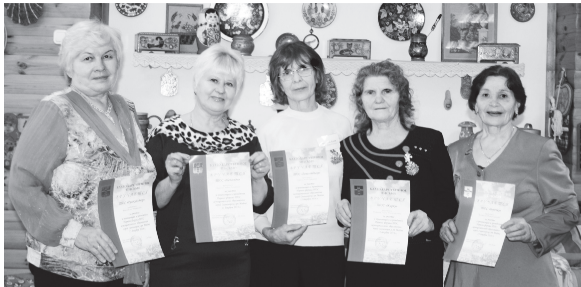
Благодарственные письма Главы муниципалитета - председателям ТОСов