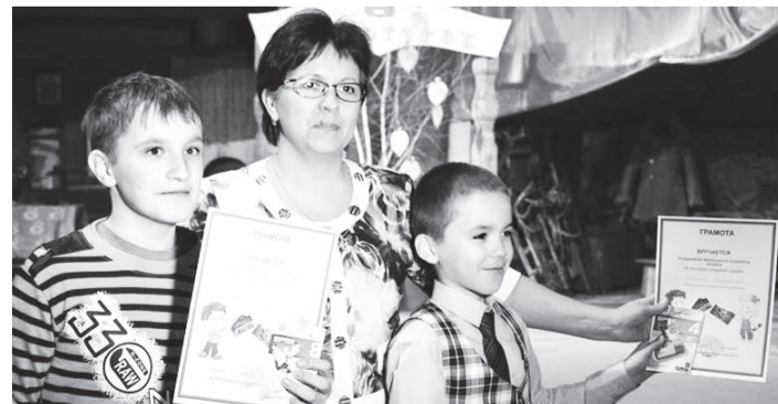
Грамоты - победителям

На прощание партнерам проекта были вручены Благодарственные письма, а участникам - Почетные грамоты, вкусные призы и памятные альбомы со снимками мероприятий проекта «Я познаю родной край».