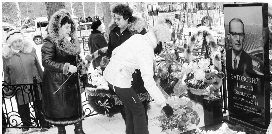
Живые цветы - на холодный камень