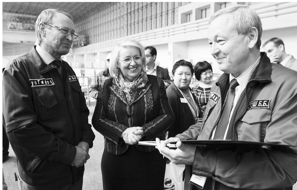
Успех саянцев - повод для радости