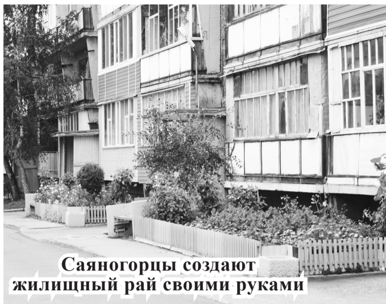
Саяногорцы создают жилищный рай своими руками

Заранее разработанное положение не ограничивало круг участников, и на призыв Общественной палаты отозвались и жильцы подъездов, и советы многоквартирных домов. Оговоривалось, что в конкурсе «Красота своими руками» не важен объем выполненных работ или их реальная стоимость. Главное, чтобы все работы были выполнены жильцами самостоятельно. Одновременно администрация Саяногорска обратилась к управляющим компаниям поддержать инициативу общественности города. И они поддержали, став участ-