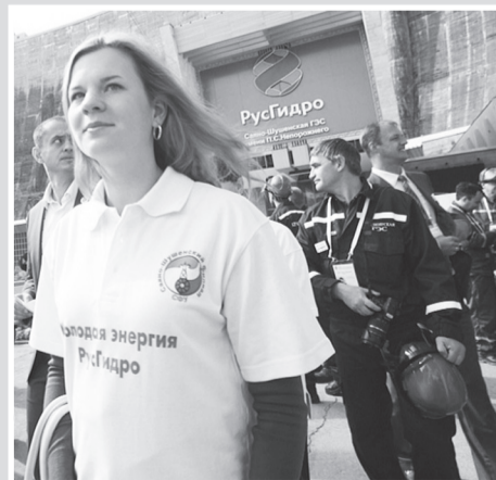
Все в гости к нам

В итоге без штрафных баллов начали соревнования четыре команды: Дагестанский филиал «РусГидро», Красноярская, Новосибирская и Чебоксарская станции. Среди штрафников больше всех, по 25 минусовых баллов, набрали Кабардино-Балкарский филиал РусГидро и Саяно-Шушенская ГЭС. Конечно, эти цифры мизер в сравнении с теми плюсовыми баллами, которые будут набирать команды на этапах соревнований, на итоговый результат штрафы вряд ли могут существенно повлиять. И все же считается особым шиком начать состязания, так сказать, с чистого листа.