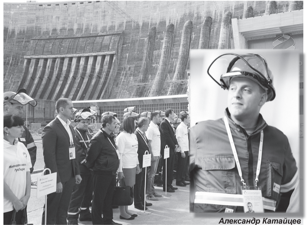
Открытие соревнований на СШ ГЭС

- Будем стремиться победить. Но не огорчимся, если этого не случится. Значит, в данное время кто-то оказался лучше, - отметил наставник команды.