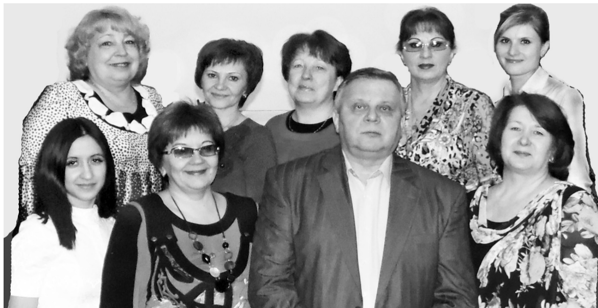
С коллегами на августовском совещании