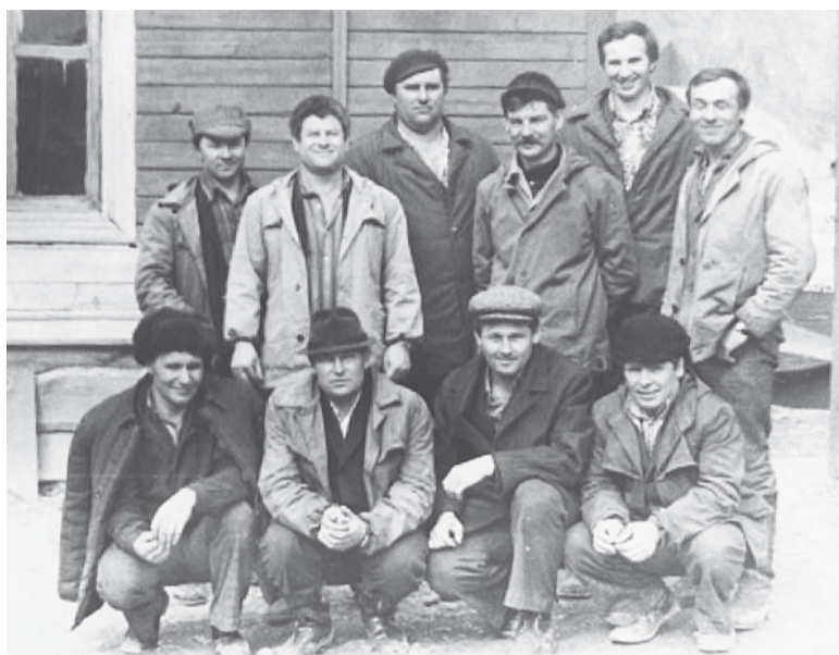
Крановщики-первопроходцы на строительстве ГЭС

- Профессии у меня не было, поэтому трудовая биография в Дивногорске началась с раскопок оврага, куда провалилась деревянная двухэтажка, - вспоминает свои первые шаги на производстве нынешний профессионал с большой буквы.