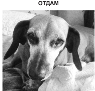
Потерялась коричневая такса. Седая мордочка, вихор на

В Новокурске найден молодой гладкошерстный кобель «аристократичной» породы. Окрас: черный «фрак», носочки и перчатки белые, глаза карие, уши висят. Предки - охотничьи собаки. Очень умный, общительный, интеллигентный пес. Тел. 89130501137 Саяногорск.