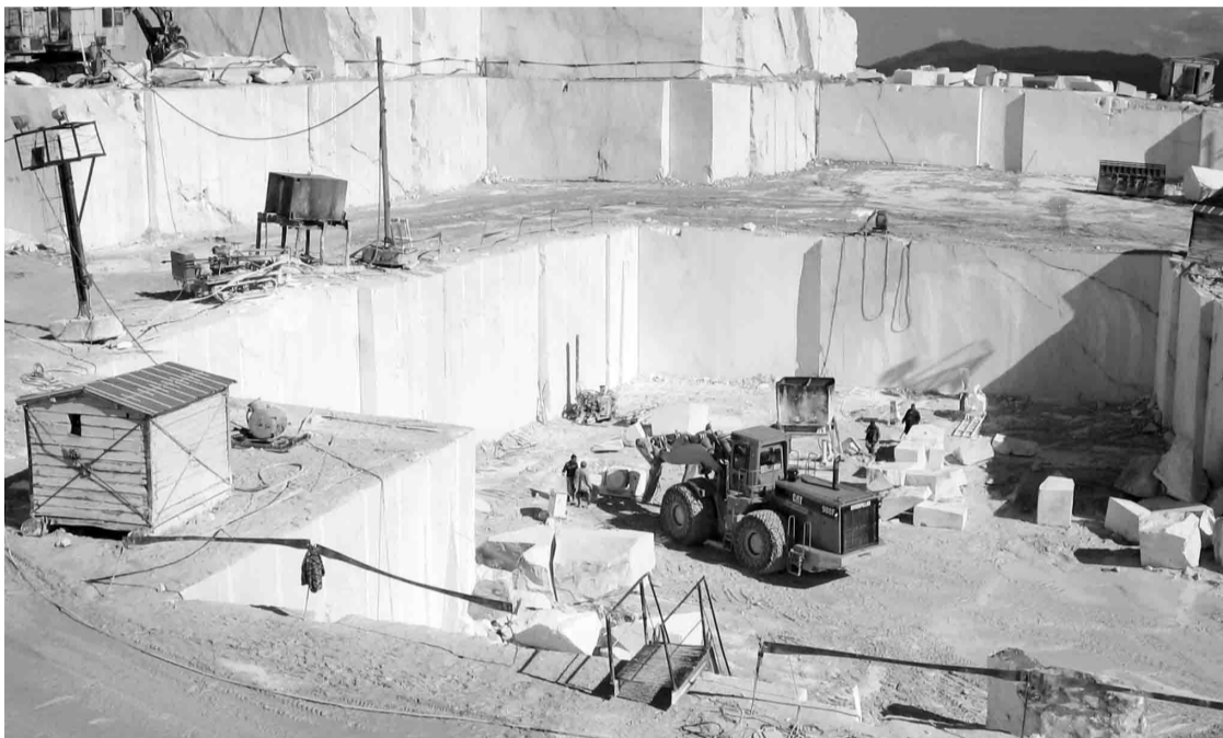
Кибик-Кордонское месторождение мрамора

22 декабря 1973 года завершилось строительство Саяно-Шушенского камнеобрабатывающего комбината, началась работа по добыче и обработке мрамора и гранита