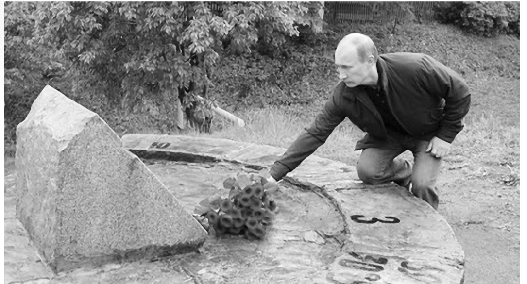
Владимир Путин 29 мая 2010 года возложил цветы к мемориалу «Братское воинское захоронение» в Невской Дубровке. Его отец сражался на «Невском пяточке» в составе 86-й стрелковой дивизии.