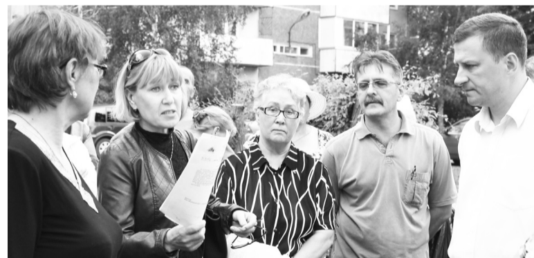
Собственники МКД зашли в тупик