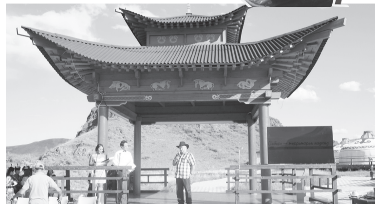
Церемония награждения победителей конкурса

В 1914 года Тува добровольно вступила под протекторат России под названием Урянхайский край в составе Енисейской губернии. Его столицей стал Белоцарск, в 1918 году переименованный в Урянхайск, в 1920-ом - Красный, в 1925 году - Кызыл. В 1944 году Тува была включена в Российскую Федерацию как автономная область, в 1961-ом преобразована в Тувинскую АССР, в 1991 году - Республику Тува. В республике проживает 330 тысяч человек (в столице - одна треть населения), из них 80% - тувинцы.