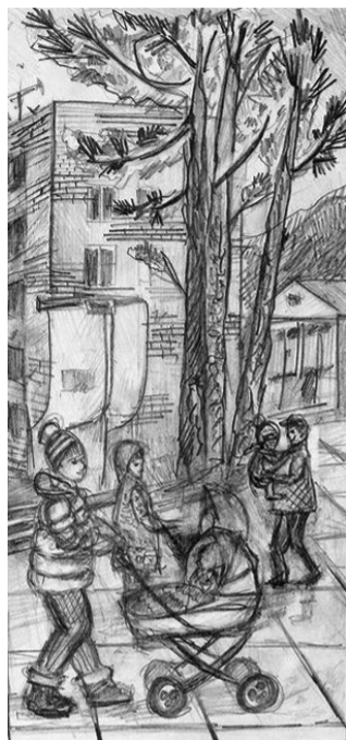
Открытка Дарьи Солтан, 16 лет

Кроме того, в преддверии юбилея 6 августа на