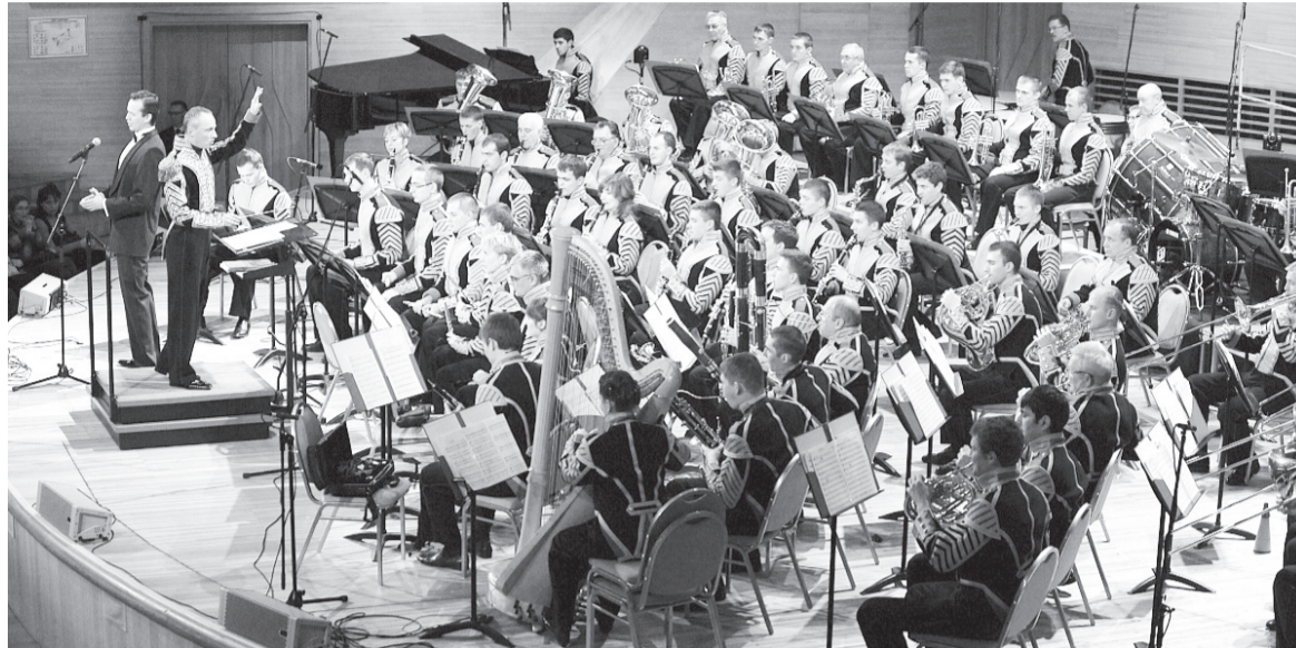
Военный оркестр Министерства обороны Российской Федерации

Внушительная музыкальная структура нынешней военно-оркестровой службы Воору-