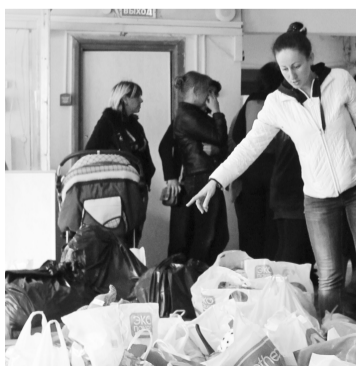
Гуманитарная помощь беженцам с Украины

Свою помощь предлагают неравнодушные жители Хакасии, благотворительные орга-