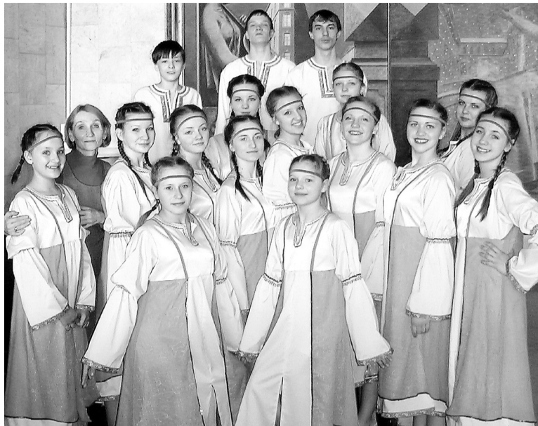
Старшая группа образцового ансамбля эстрадного танца «Ритм»

- Ну, мы же поедem в Париж... Мечта росла, зрела долгие