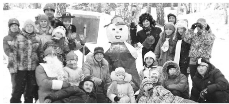
Участники марафона