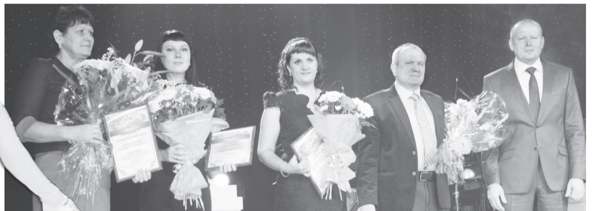
Победители конкурса среди субъектов предпринимательства