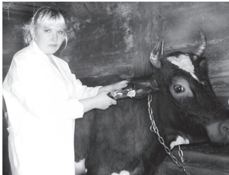
Каждой корове - паспорт (процесс биркования)

По первому пункту решения схода письменных обращений от владельцев сельскохозяйственных животных с просьбой согласовать маршруты не поступило. По второму - получен положи-