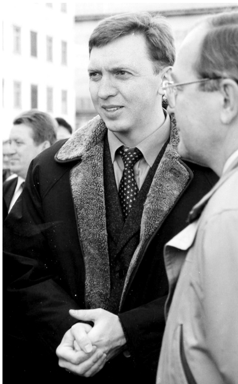
Олег Дерипаска на пуске 7-8 корпусов САЗа

К тому моменту САЗ находился в орбите интересов местных криминальных кругов. В Саяногорске орудовала преступная группировка, возглавляемая