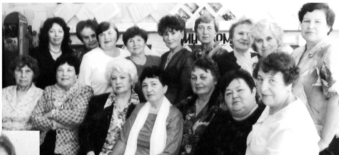
Актив совета ветеранов труда и пенсионеров микрорайонов города

рячо взялась за дело, так как у нее уже был накоплен опыт работы с людьми. Ей пришлось пережить и радостные, и грустные минуты, потому что приходилось общаться с разными