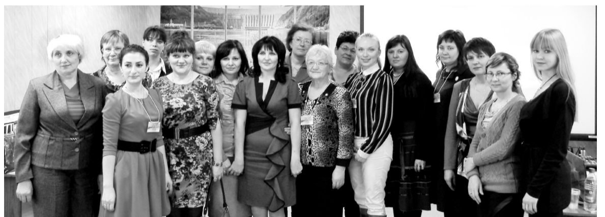
Гости и участники фестиваля