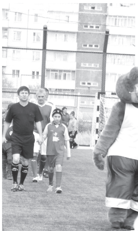
Праздник на поле с искусственным покрытием

Есть с чем сравнить: аренда искусственного поля в Саяногорске в разы дешевле, чем в других городах.