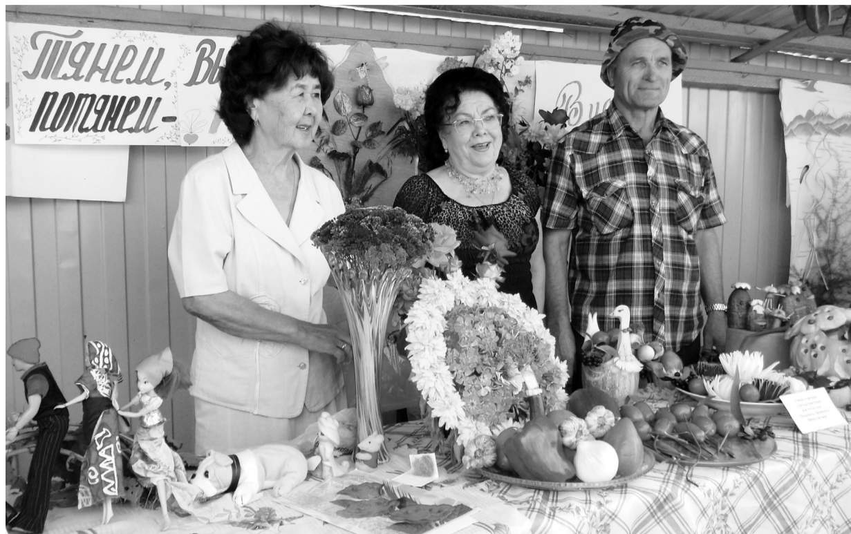
День поселка Майна-2014