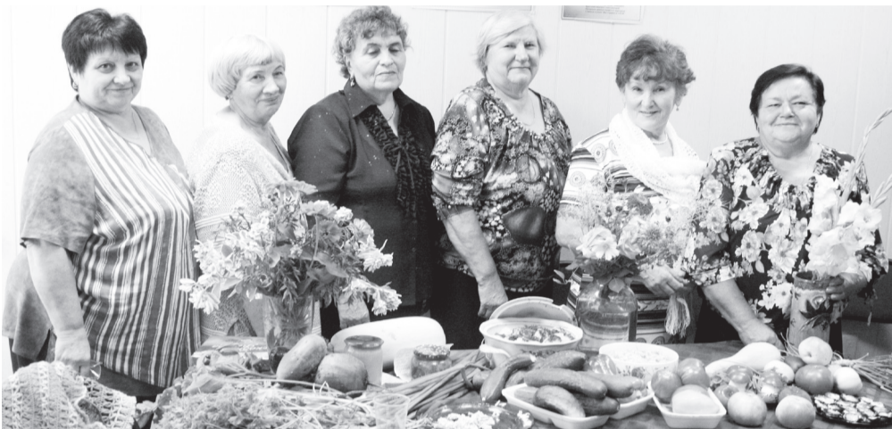
Никто не повторился в ассортименте представленных блюд

Вазы и блюда, наполненные вкусно-свежим и спелозрелым угощением, изумили и умилили участников и гостей выставки «Дары осени» в Общественной палате Саяногорска