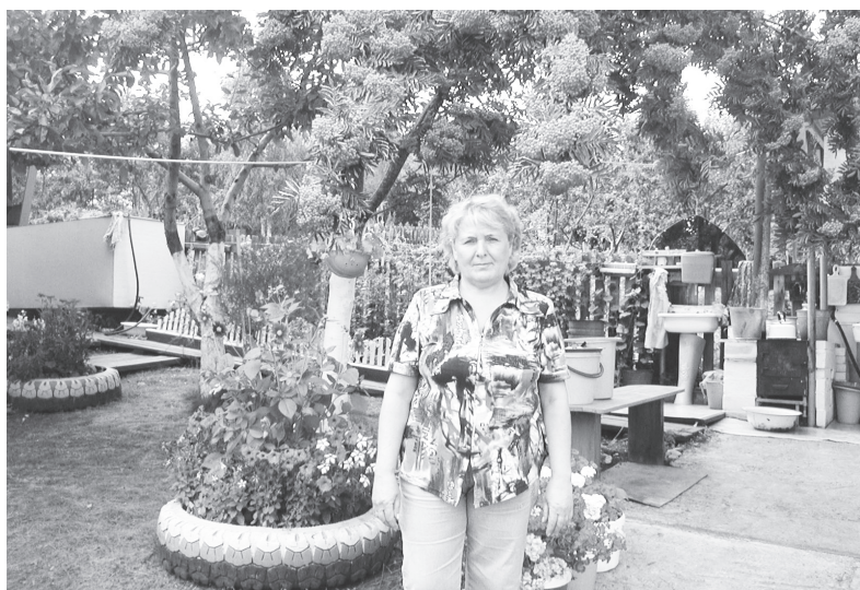
Наш дворик такой уютный!

На территории муниципального образования г.Саяногорск зарегистрировано в качестве юридических лиц 19 садовых некоммерческих товариществ (СНТ). Все они, согласно действующему законодательству, несут ответственность за санитарное содержание своих территорий.