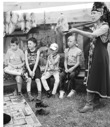
Так все интересно!