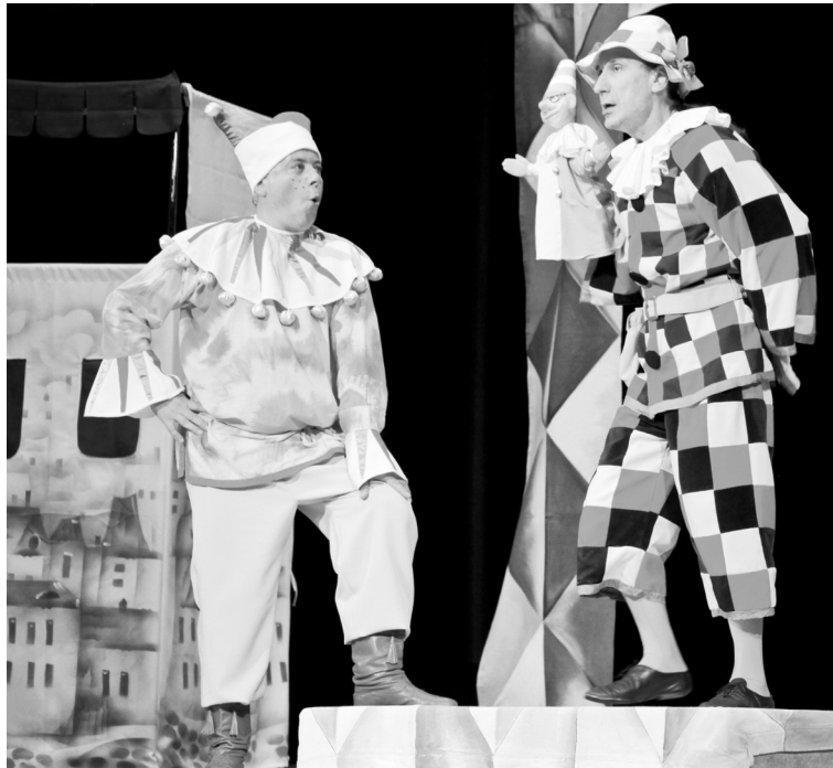
Спектакль «Петрушка и Ко» прошел с успехом

Надо сказать, что жители поселка всегда охотно посещают театральные постановки. Благодаря энергетикам в