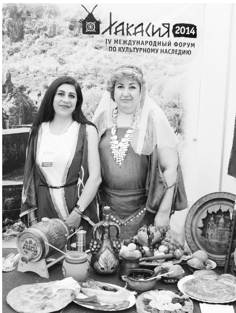
Армянская кухня? Вах! Вах!

- Русская кухня, хоть и простая, да самая здоровая. Более того, русичи знали, что хлеб да соль зовут к миру, к теплу домашнего очага. Они предпо-