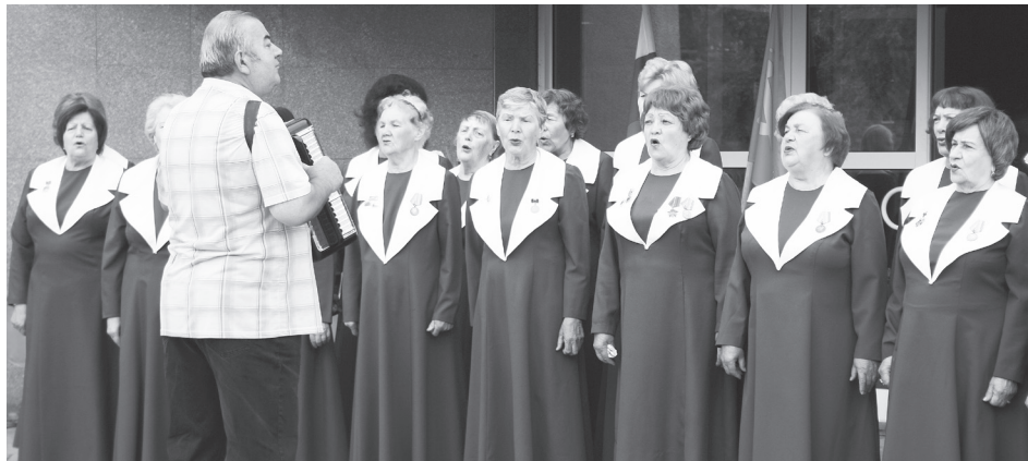
Выступление на мероприятии, посвященном Дню памяти и скорби

Народный хор ветеранов г.Саяногорска стал лауреатом I степени Международного Интернет-конкурса «Поклонимся великим тем годам»