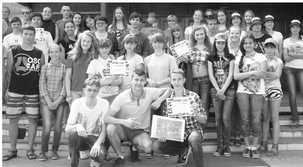
Пришкольный лагерь - это мы

Но мы упорно продолжали искать людей в желтом. Наконец-то мы встретились с ними и получили задание: назвать 10 овощей и столько же фруктов за 30 секунд. Увы! В отведенное время сделать это не