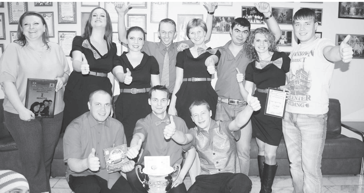
Победитель фестиваля работающей молодежи - команда «13 элемент»