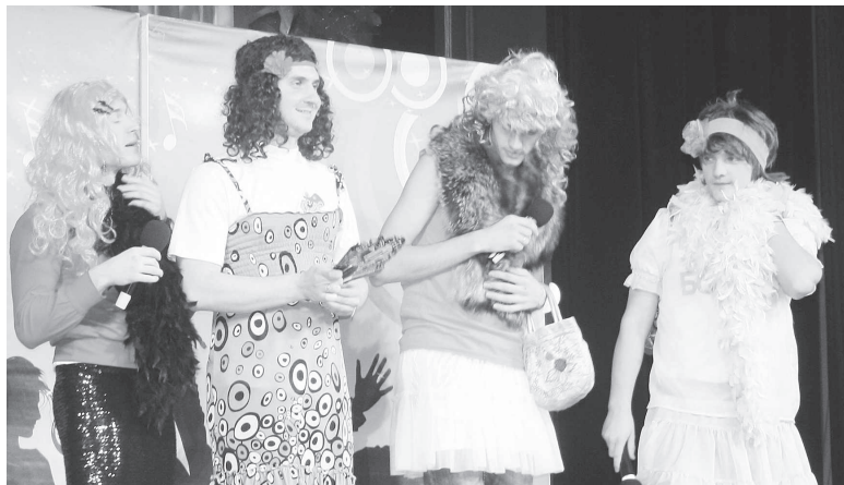
«Девушки» из команды «Бобры»