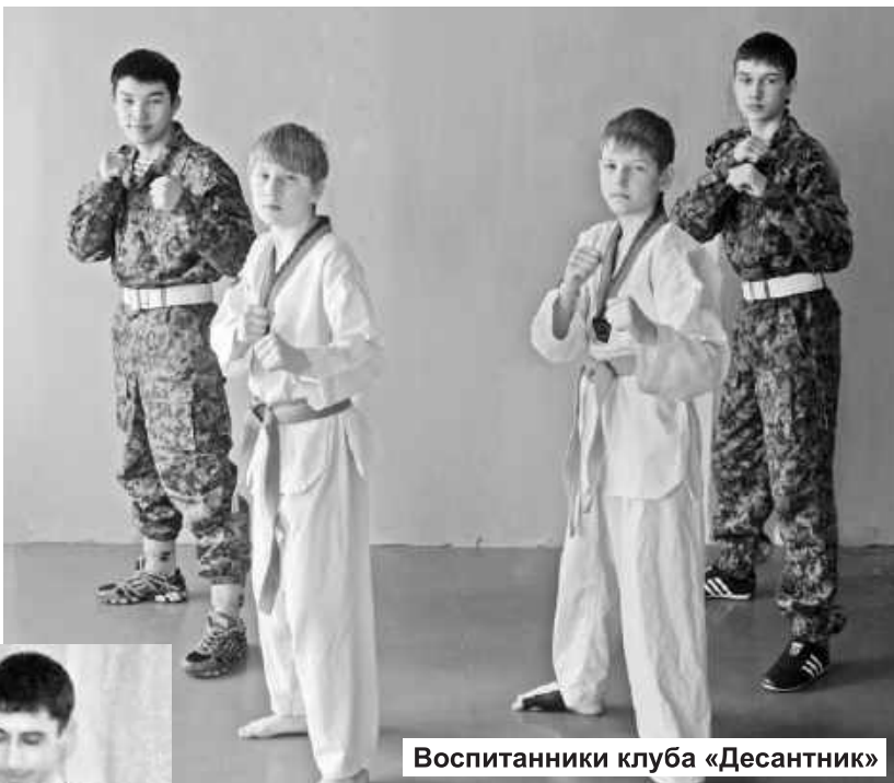
Воспитанники клуба «Десантник»

В районах и городах Республики Хакасия прошла единая профориентационная акция «Новые рубежи»