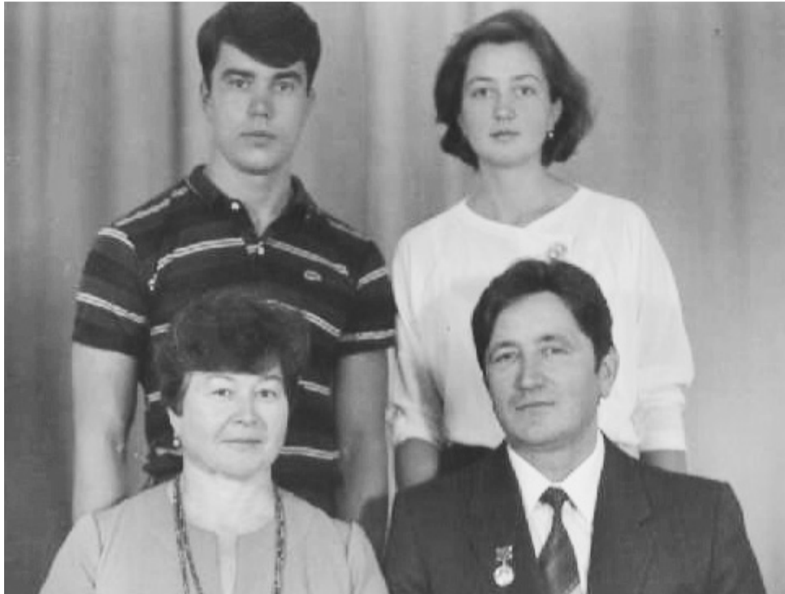
Все вместе - душа на месте