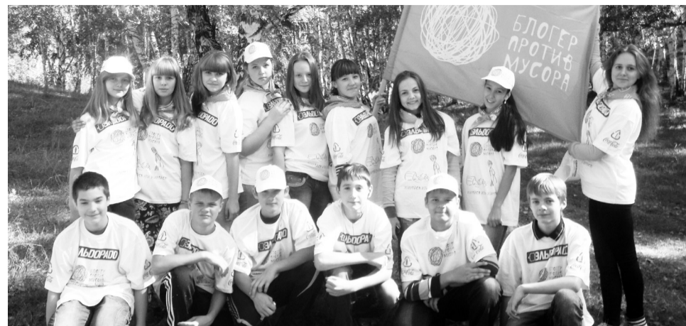
Добровольцы из лицея №7

- Как можно за каждым углом устривать, простите, туалет? Через проулок