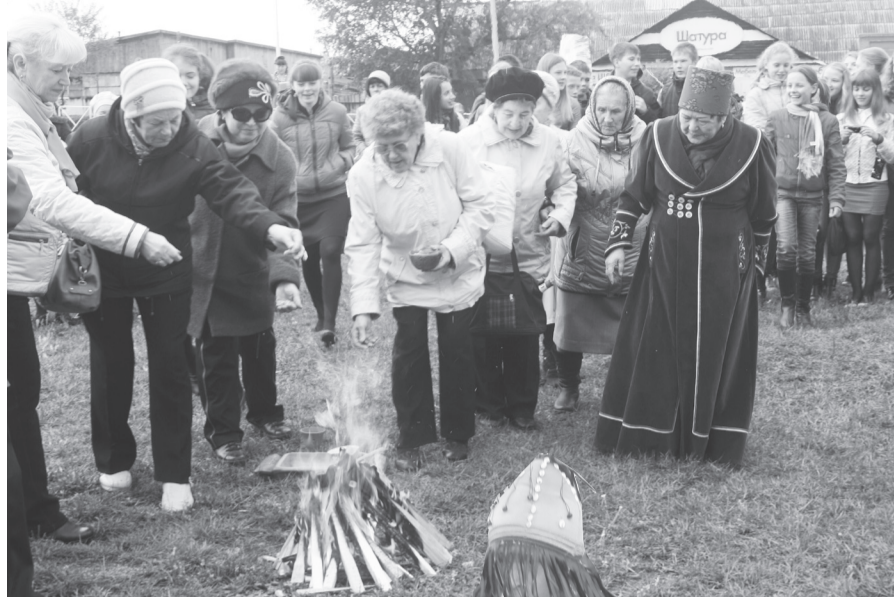
Ритуал кормления огня

словам все верят. Она говорила о том, что хакасы, как и все тюркские народы, твердо знают: у огня есть хозяин, который является проводником между ними и небесными творцами. К духу огня они обращают свои молитвы, отдают лучший кусок с семейного стола. Очищенные дымом тлеющей богородской травы избавляет человека от накопленного негатива, усталости, неприятных мыслей и заряжает позитивом и энергией.