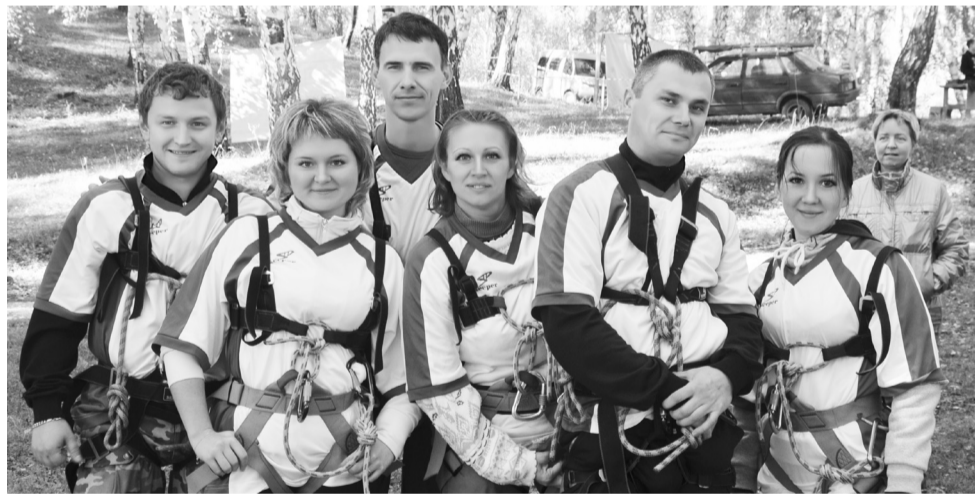
Команда «Муниципальная братва»