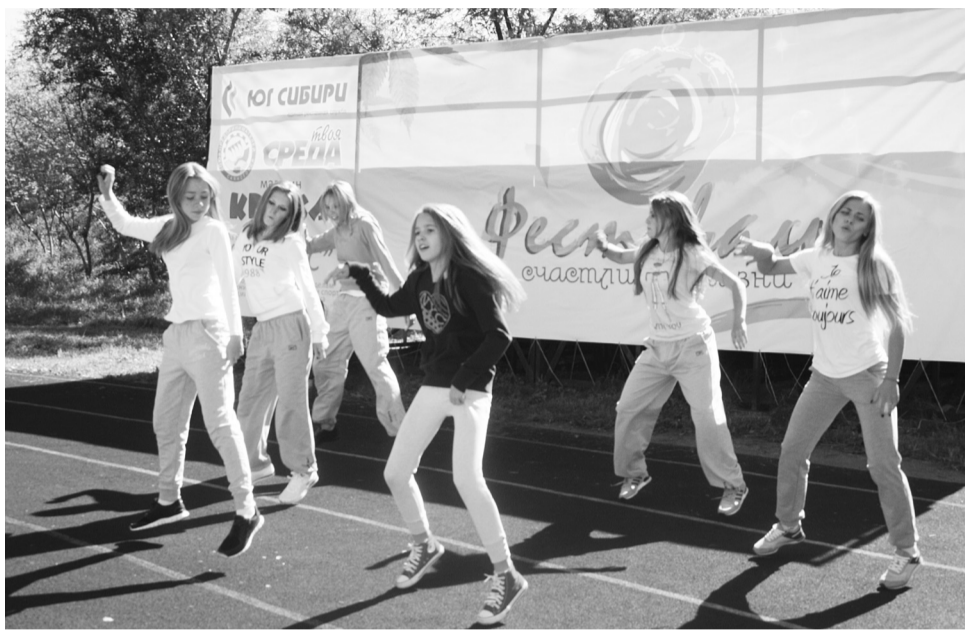
Танцевальная группа «Mavement»