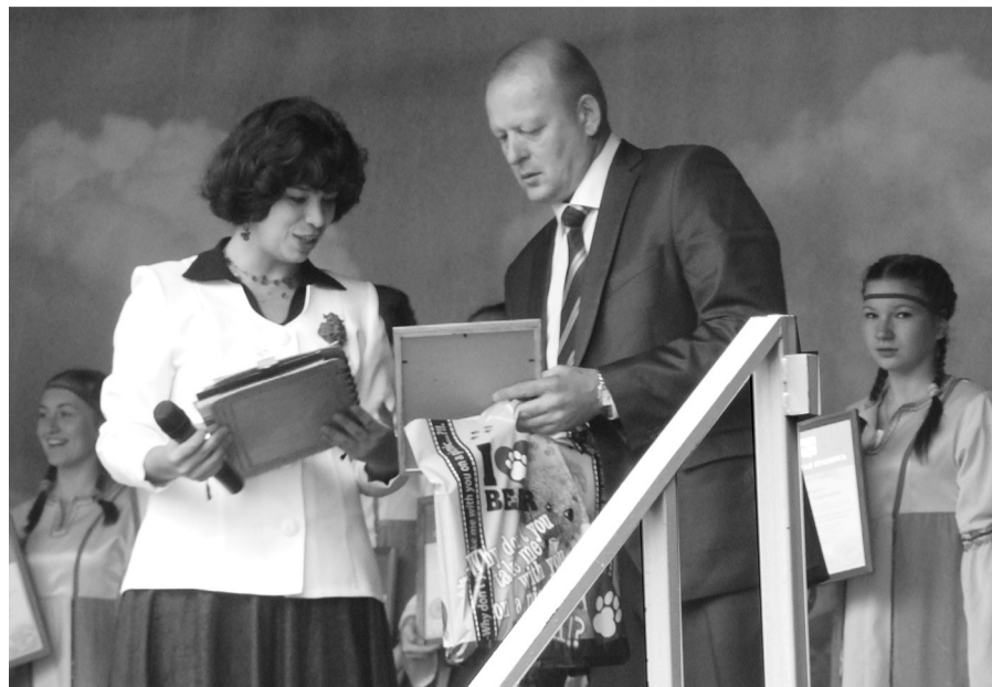
Награждает Глава города

Ярким завершением праздника стали концерт Народной артистки России Людмилы Сенчиной, танцевальная шоу-программа и красочный фейерверк, озаривший пасмурное небо сотнями разноцветных огней.