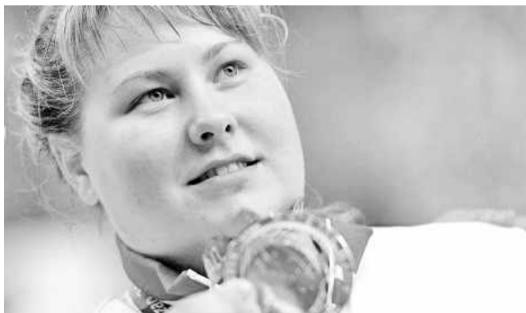
Это сладкое слово «победа»...