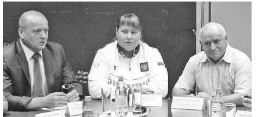
Глава города поздравляет с победой