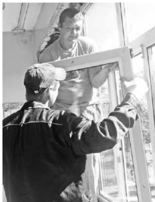
Замена окон в школе №2

Руководитель гороо отмечает: - Пожалуй, самый настоящий ремонтный бум наблюдается в школе №2. Здесь привели в порядок инженерные сети, ус-