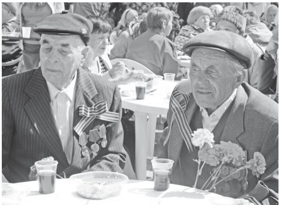
Вспомним юности года