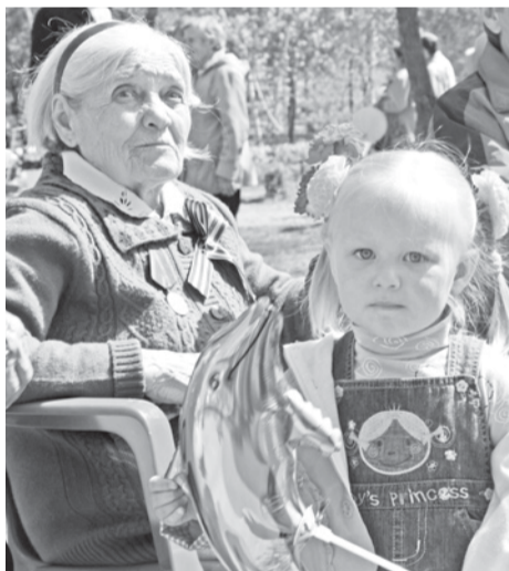
Горжусь своей прабабушкой