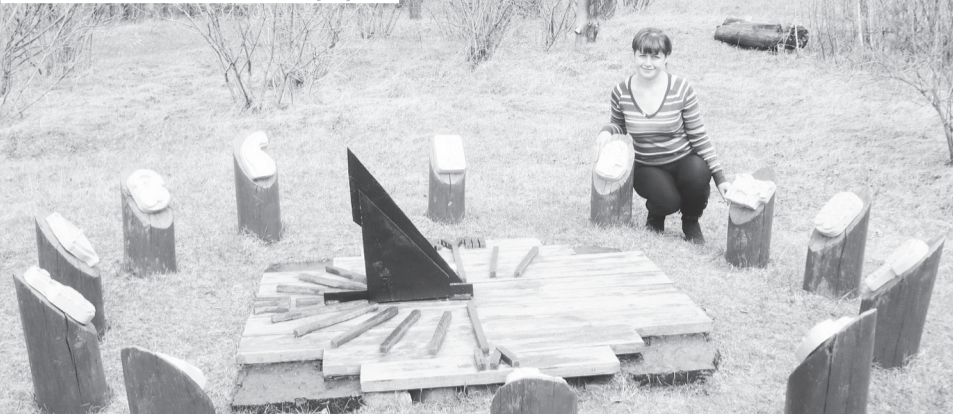
Солнечные часы в дендрарии