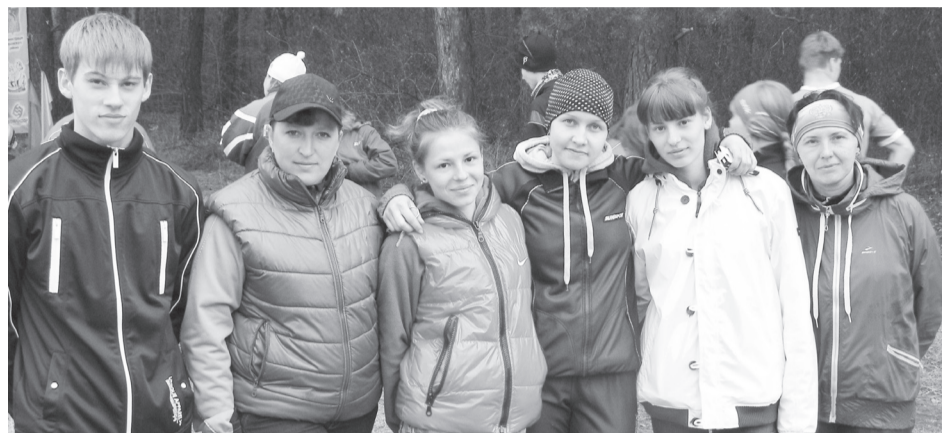
Саяногорцы! Вперед к победе!

Из десяти субъектов Сибирского Федерального округа на состязания приехало рекордное количество участников - 450. В их числе - воспитанники Любови Романюк - учителя физкультуры школы №5, руководителя секции «Спортивное ориентирование».