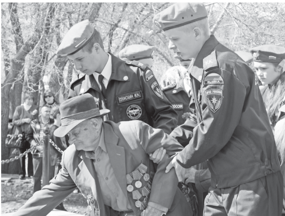
Мы - надежная смена