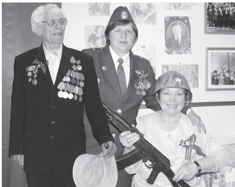
Помните, что вслед за вами смотрят те, кто жил во имя вас

Из года в год заметно редуют ряды участников Великой Отечественной войны и тружеников тыла, которые выстояли и выжили в той страшной «мясорубке» всем смертям назло. - В годы моей юности огромная колонна фронтовиков шла по улице Ленина на Парад Победы, - вспоминает начальник отделения социального и пенсионного обеспечения