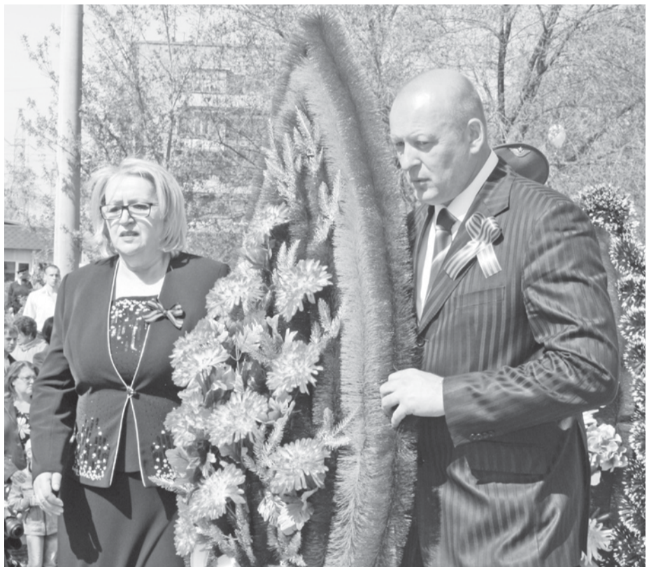
Трепетные минуты (Ирина Смолина, Леонид Быков)