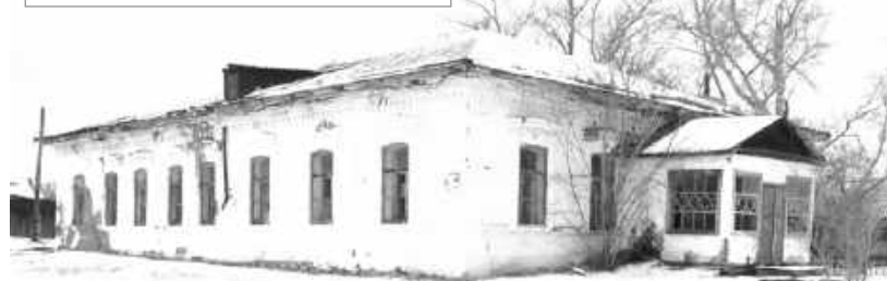
Старая школа в селе Сабинка

родской ярмарке он завоевал золотую медаль.