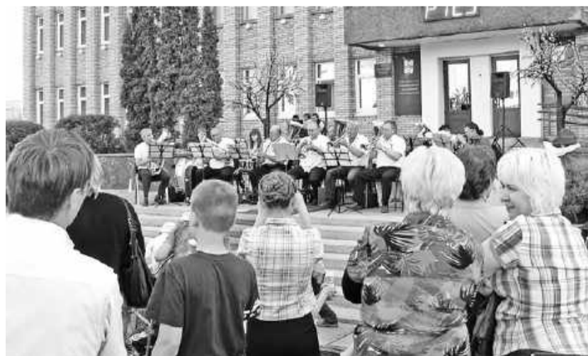
Материалы подготовили пресс-службы администрации, САЗа, ИА «Хакасия»

Теперь два раза в месяц саяногорцы и гости города могут послушать живую музыку. Двадцать первого июля на площади администрации города состоится очередной бесплатный концерт. Приглашаются все желающие.