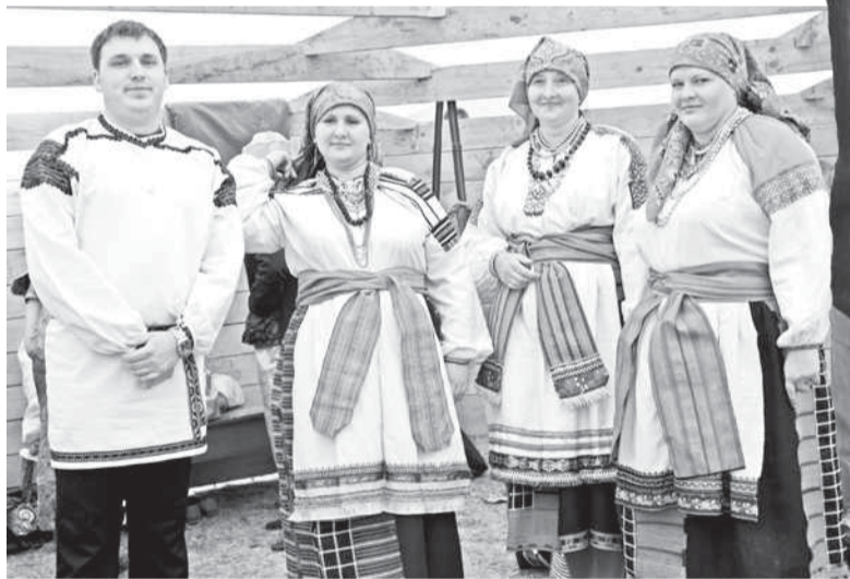
Народный ансамбль «Авсень»

вов в рамках форума «Историко-культурное наследие как ресурс социокультурного развития региона» начинается!