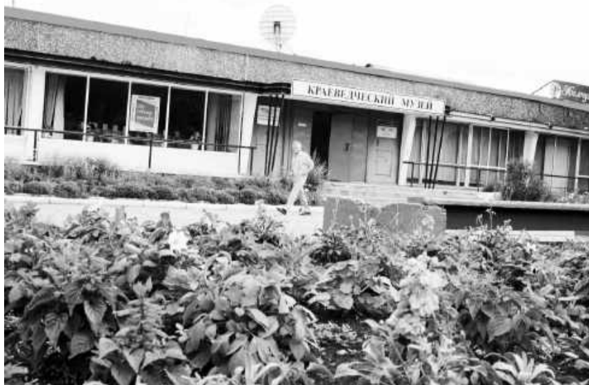
Цветочный пламень глаз радуется

Не осталась за пределами внимания городского сообщества еще