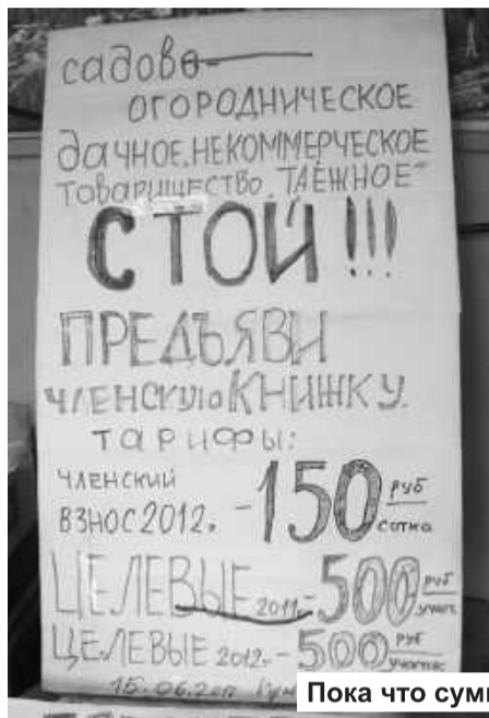
Пока что суммы только на плакате