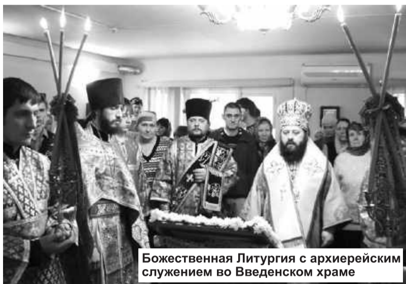
Божественная Литургия с архиерейским служением во Введенском храме