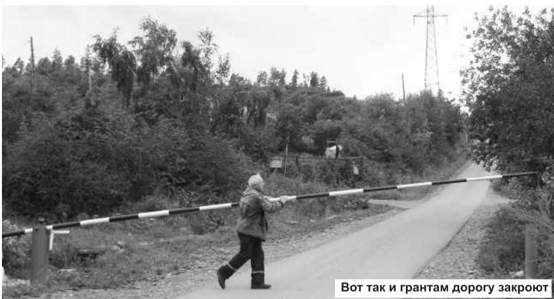
Вот так и грантам дорогу закроют

убедить комиссию, что садоводы нуждаются в помощи. И получили два миллиона! На эти средства заасфальтированы 1500 погонных метров проблемных участков дорог на 16 из 20 улиц. Отремонтирована размороженная десять лет назад цистерна, закуплено 25 столбов для ЛЭП, установлен шлагбаум, начаты работы по ликвидации свалки. Заменен на новый, более мощный насос, подающий воду на дачи, а также трубы на насосной станции, поставлен затвор на водозаборе ручья Черемуховый, за счет чего уровень воды в прямке повысился на два метра и появилась возможность подавать воду на участки не один раз в день, а два. Этими благами уже пользуются все дачники, а целевые взносы заплатили лишь 200. Например, на самой «густонаселенной» Садовой улице 96 участков. На 31 августа целевой взнос уплатил только один хозяин!.. Это тоже - арифметика. Что дальше?