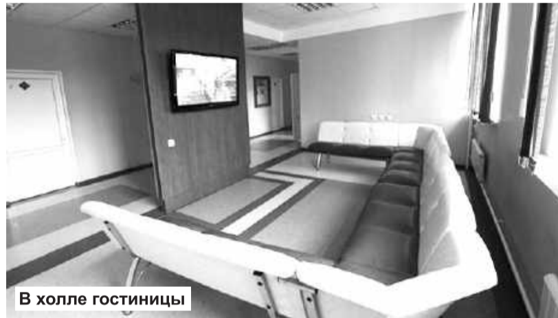
В холле гостиницы

кательная. Вот почему растет популярность гостиничного комплекса «Кантегир»!