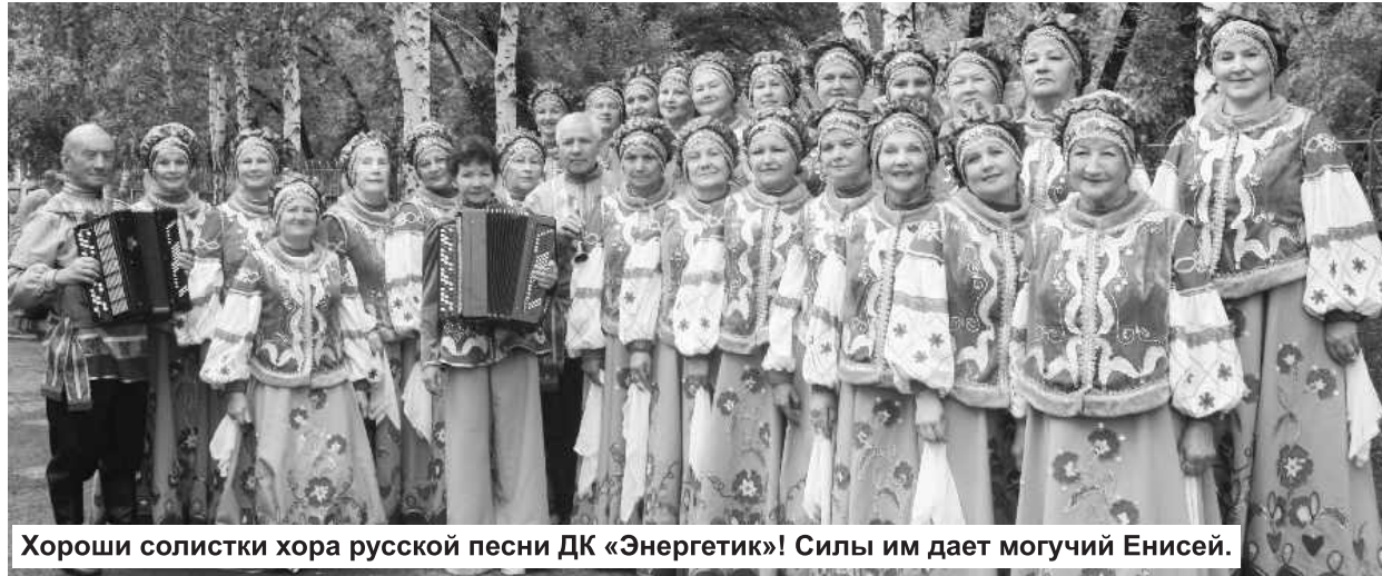
Хороши солистки хора русской песни ДК «Энергетик»! Силы им дает могучий Енисей.

Оказалось, что мы и еще несколько конкурсантов приехали на день раньше. Организаторы воспользовались такой возможностью и отправили нас выступить перед жителями поселка Марьяновка. Они первыми прослушали весь наш репертуар.