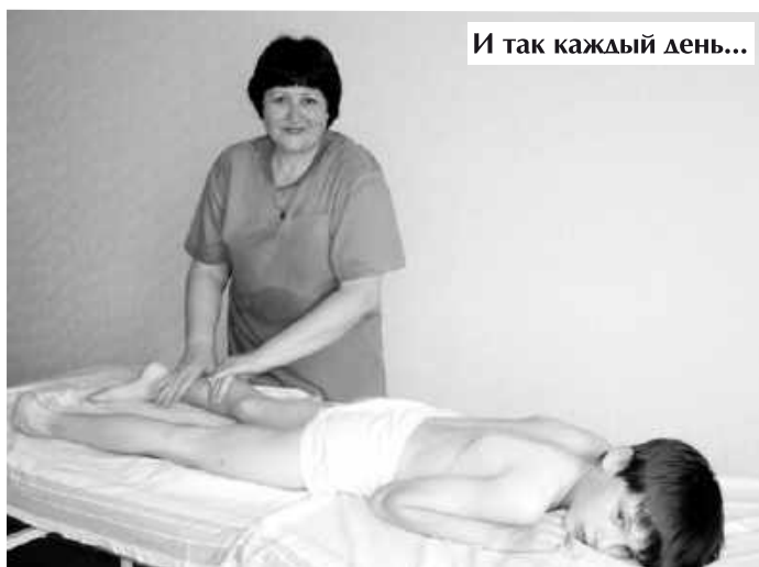
И так каждый день...

Глядя на нее, ни на минуту не сомневаюсь в этом: по лицу струятся капельки