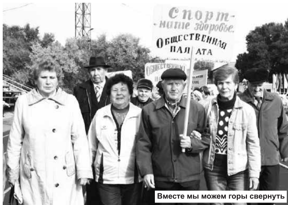
Вместе мы можем горы свернуть

Наконец, разноцветная людская река выстраивается для награждения. Наступает долгожданный момент вручения медалей победителям, Благодарственных писем, сладких призов и подарков - командам. Первая городская Спартакиада «Старшее поколение выбирает спорт!» уходит на страницы славной летописи города у подножия Саян.