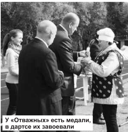
У «Отважных» есть медали, в дартсе их завоевали