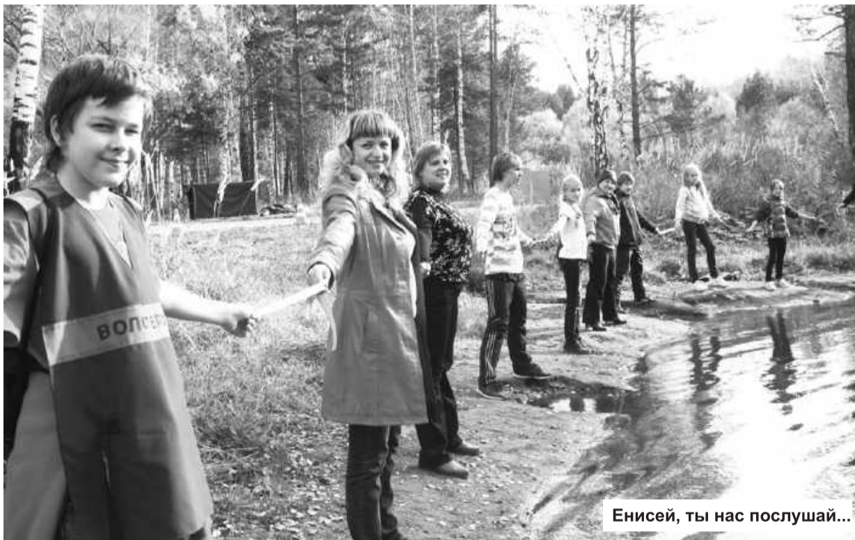
Енисей, ты нас послушай...

В это время на пляже возле пристани открывает пышущие жаром котлы полевая кухня: кому чаю с конфеткой и пече-