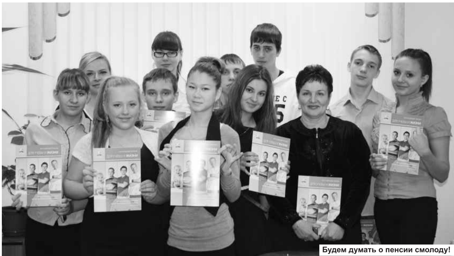
Будем думать о пенсии смолоду!