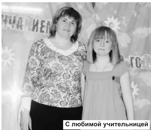
С любимой учительницей