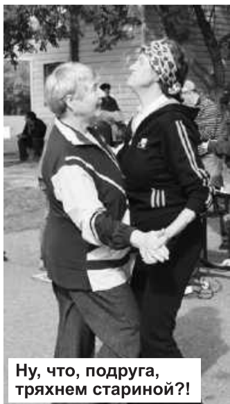
Ну, что, подруга, тряхнем стариной?!