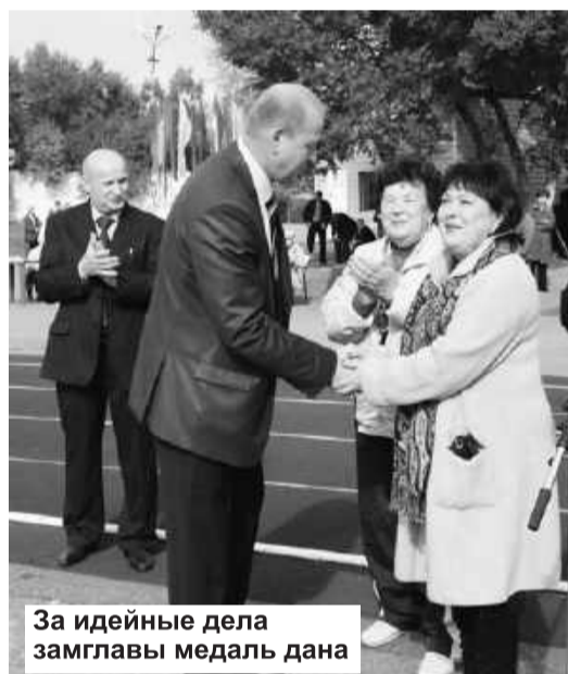
За идейные дела замглавы медаль дана