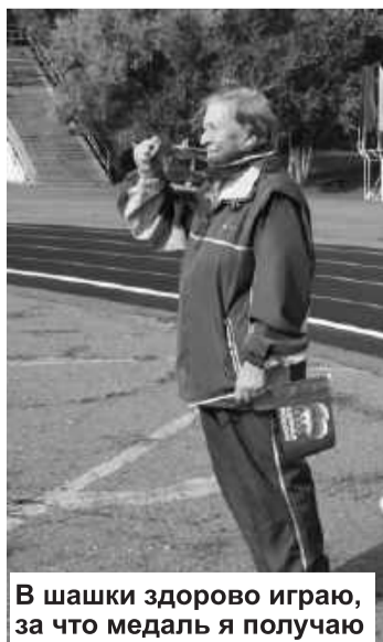
В шашки здорово играю, за что медаль я получаю