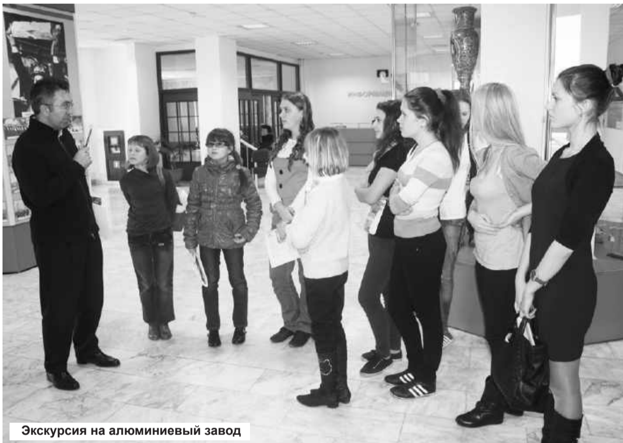
Экскурсия на алюминиевый завод