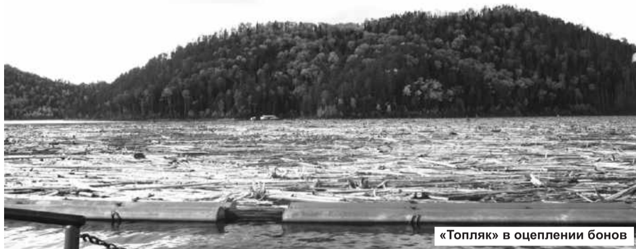
«Топляк» в оцеплении бонов