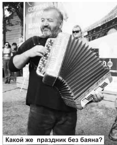
Какой же праздник без баяна?