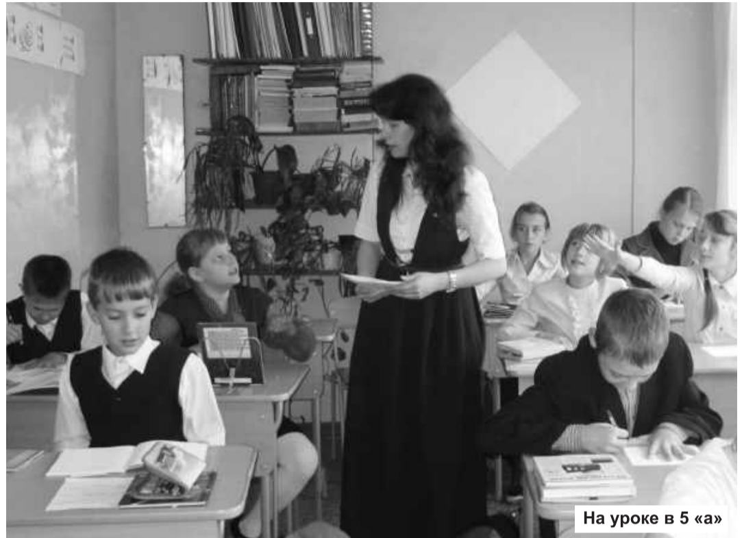
На уроке в 5 «а»

Древняя мудрость гласит: «Велик тот учитель, который исполняет дело, чему учит, владеет всеми секретами своей профессии, потому что добросовестно и успешно проходит все ее ступени». Это в полной мере относится к моей ге-