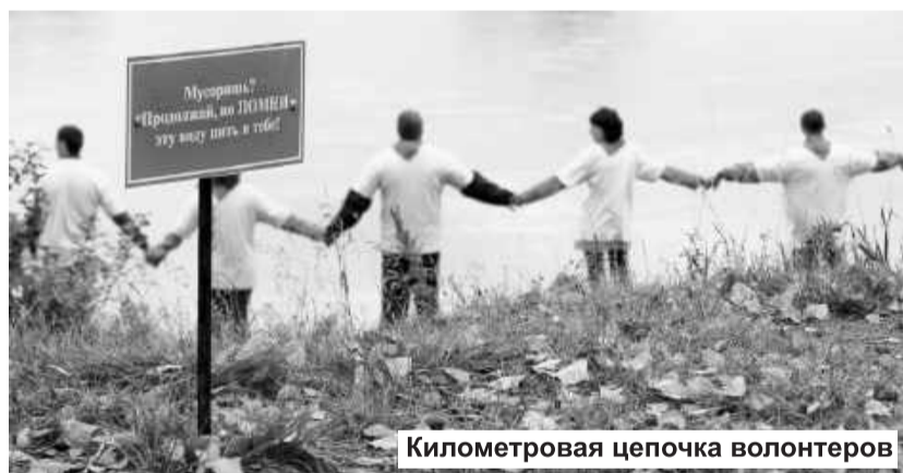
Километровая цепочка волонтеров

Предложение металлургов и экологов было поддержано населением, проживающим на берегах сибирской реки, и направлено Главе Республики Хакасия Виктору Зиминову и Губернатору Красноярского края Льву Кузнецову. Решение об учреждении праздника «День Енисея» было принято в обоих субъектах федерации. Этот экологический проект поддержал и президент Российской Федерации Владимир Путин.