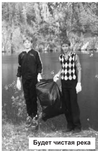
Будет чистая река

Косые тени от прибрежных кустов и деревьев пересекают дорогу, а праздник у холодных вод Енисея продолжается! С таким настроением маленькие проблемы сибирского исполнения никогда не выльются в экологическую катастрофу материкового масштаба!