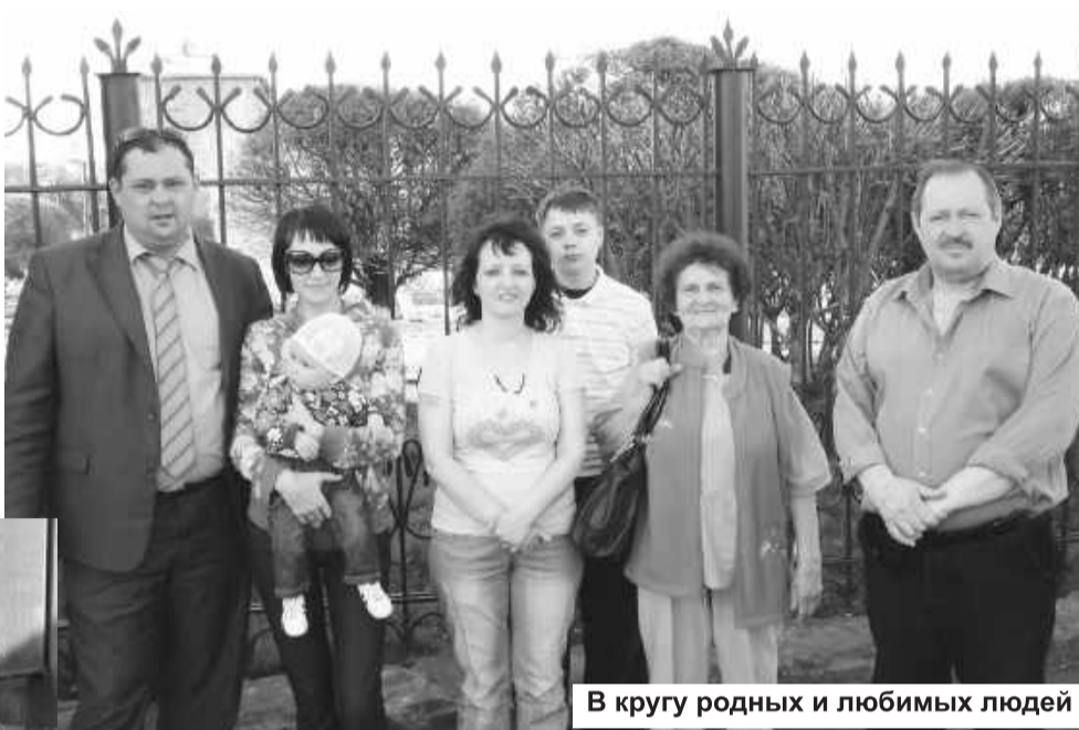
В кругу родных и любимых людей

Перестройка внесла свои коррективы в экономику и жизнь горожан. Исключением не стал и