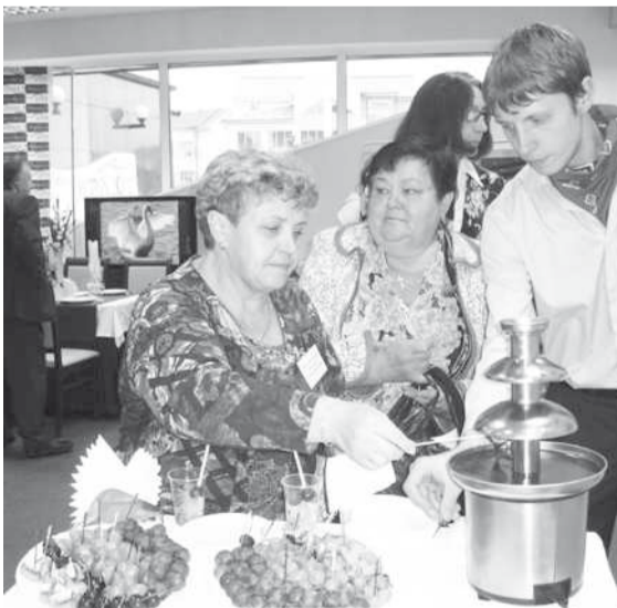
Угощает ресторан «Меридиан»