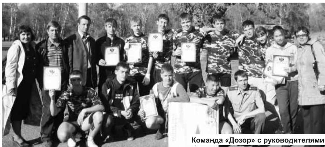
Команда «Дозор» с руководителями

Спасибо организаторам республиканской игры, которая еще больше сдружила и сплотила нас, помогла найти новых друзей!