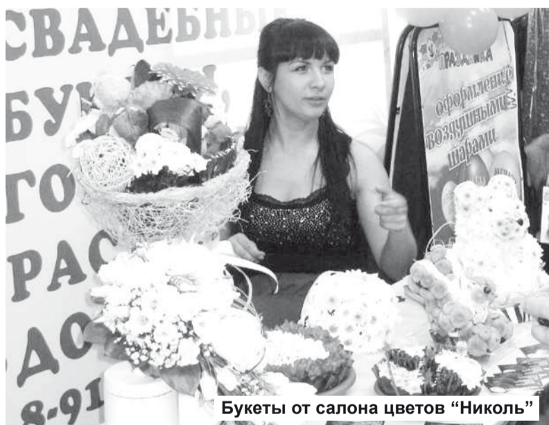
Букеты от салона цветов «Николь»