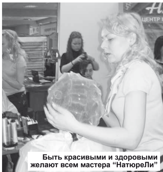
Быть красивыми и здоровыми желают всем мастера «Натюрели»