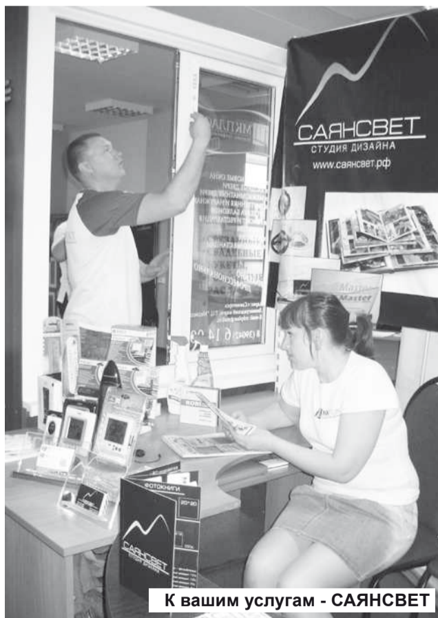
К вашим услугам - САЯНСВЕТ