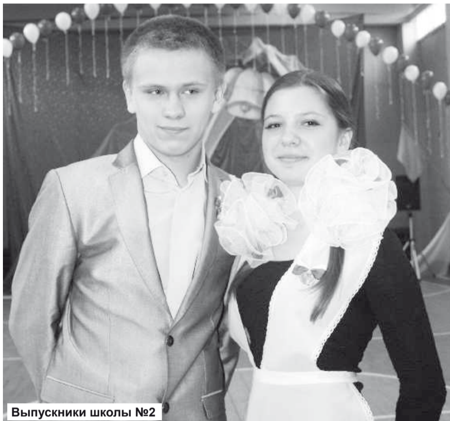
Выпускники школы №2