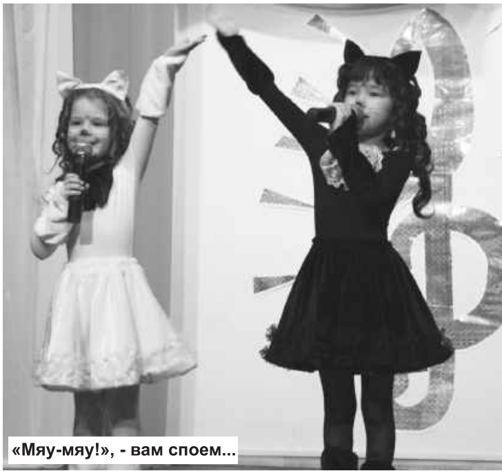
«Мяу-мяу!», - вам споем...

В фойе ЦДТ участники мероприятия полюбовались произведениями настоящего искусства. Маленькие очумелые ручки дошколят со своими руководителями сотворили настоящие чудеса. Особенно много цветов, которые юные мастера сделали из теста, бисера, валяной шерсти, поролона, бумаги, салфеток, ниток... Красота!