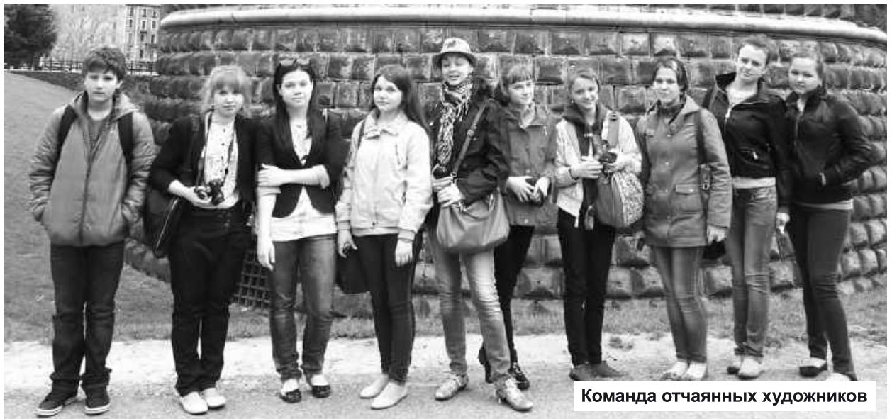
Команда отчаянных художников

Дальнейший путь лежал в маркаронный рай, обитель самой вкусной пиццы, а главное, в страну, где родились и работали вели-