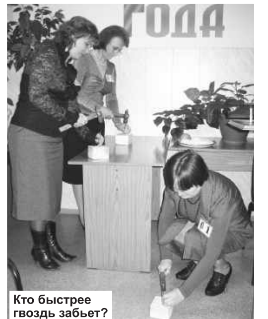
Кто быстрее гвоздь забьет?