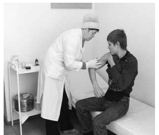
Материалы подготовили Ирина ЗИНЧЕНКО, пресс-службы администрации, САЗа