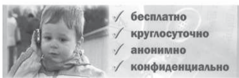
бесплатно, круглосуточно, анонимно, конфиденциально