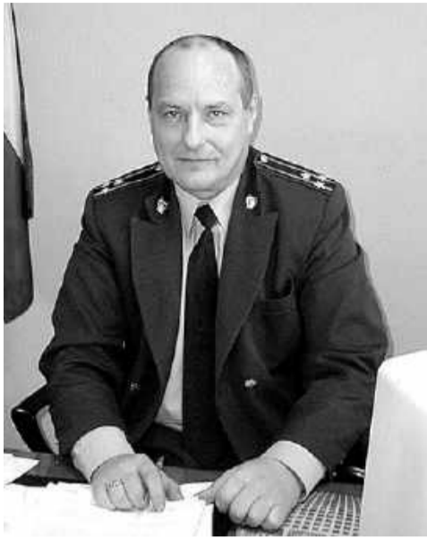
Нормативные правовые акты