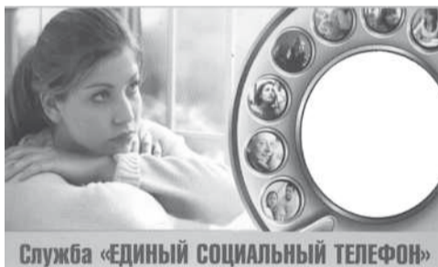
Служба «ЕДИННЫЙ СОЦИАЛЬНЫЙ ТЕЛЕФОН»

Единый телефон пожарных и спасателей – 01 (с моб. – 01* вызов). Единый телефон спасения - с моб. – 112. «Телефон доверия» ГУ МЧС России по Хакасии – 8(3902) 299-233. ГОиЧС по г.Саяногорску – 2-11-97.