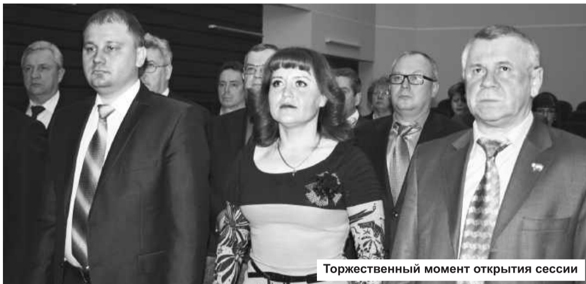
Торжественный момент открытия сессии