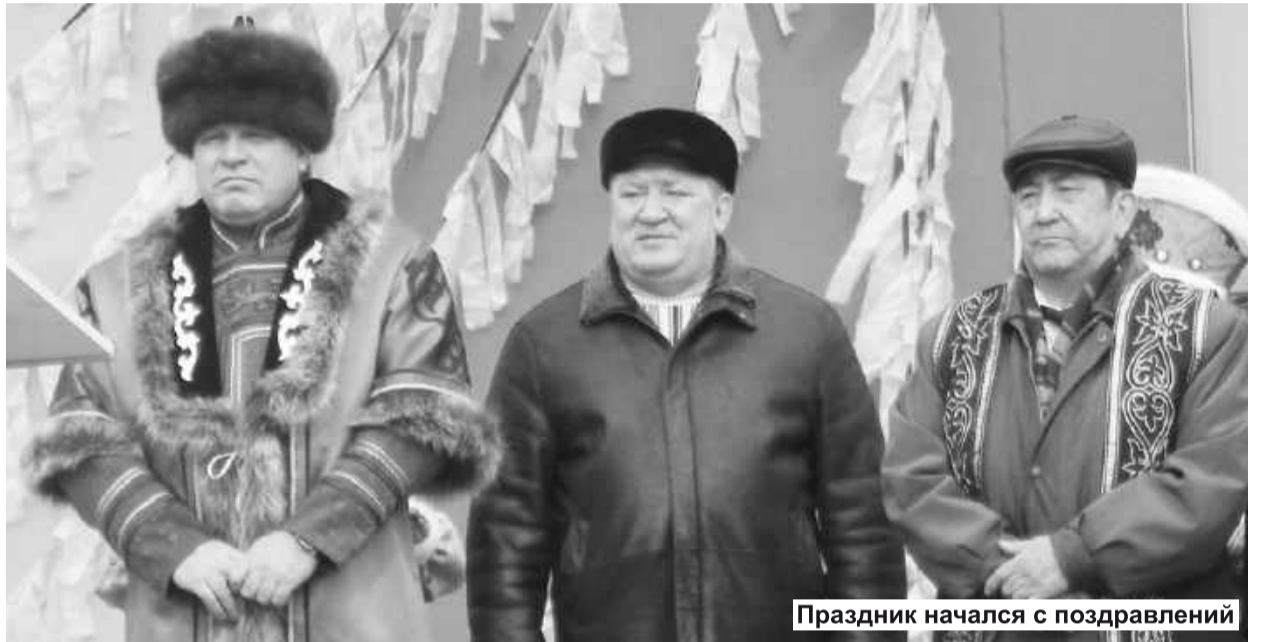
Праздник начался с поздравлений

Абаканский ипподром, где 24 марта развернулось веселое празднование Чыл Пазы – хакасского Нового года, стал центром притяжения республики всей