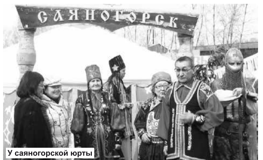
У саяногорской юрты

Кроме гостинцев, саяногорцы везли в родной город Диплом за участие в конкурсе юрт, подписанный Главой республики. Но еще важнее то, что все остались довольны временем, проведенным в столице Хакасии. Если на следующий год подвернется возможность обновить впечатления, каждый участник Чыл Пазы-2012, не раздумывая, шагнет под флаг Саяногорска. А пока... С Новым годом!