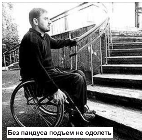
Без пандуса подъем не одолеть

В 2011 году прокуратурой города продолжена работа в сфере дополнительного лекарственного обеспечения граждан. Установлено, что ситуация по льготному обеспечению лекарственными средствами в городе удовлетворительная. Нет задолженности по финансированию поставленных лекарственных средств. Рецептов на длительно отложенном обслуживании не имеется.