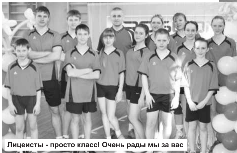
Лицейсты - просто класс! Очень рады мы за вас

На смену одним состязаниям приходят другие. Наступает черед эстафет с обручами, баскетбольными мячами, гимнастическими палками. Диву даешься, какую надо иметь координацию движений, чтобы одновременно вести два баскетбольных мяча! Бежать с тремя, зажатых между телами, или прыгать подобно африканской горилле, удерживая одновременно тяжелые мячи под мышками и между ног.