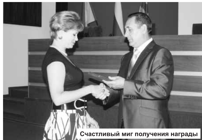
Счастливым миг получения награды