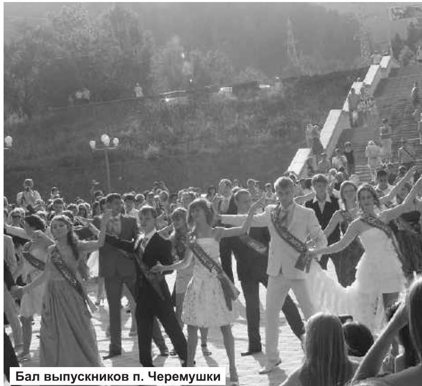
Бал выпускников п. Черемушки

смотрится более чем достойно. Каждый из выпускников понимал, что учителя и родители сделали свое дело, теперь все зависит от них самих.