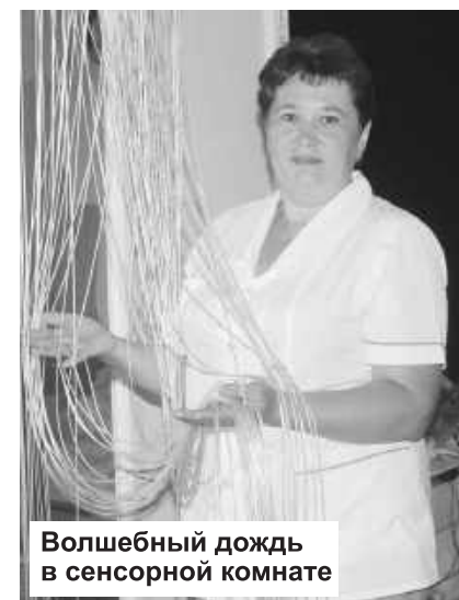
Волшебный дождь в сенсорной комнате

Положительный результат дают и занятия на тренажерах в специальных лечебных костюмах, оз-