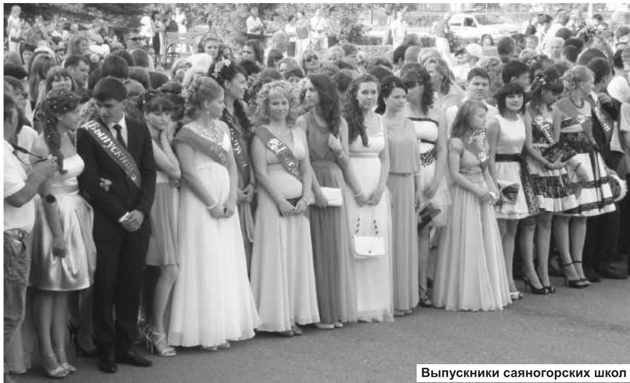
Выпускники саяногорских школ

то, что 11 классов остались позади. Отношением к учебе и стремлением к покорению трудных вершин вчерашние школьники доказали, что новый этап жизни их не страшит. Как итог - трое лицеистов добились на ЕГЭ наивысших результатов по трем предметам – 100 баллов из 100 возможных. Не подвели и другие ребята, поэтому на образовательном небосклоне Республики Хакасия наш город