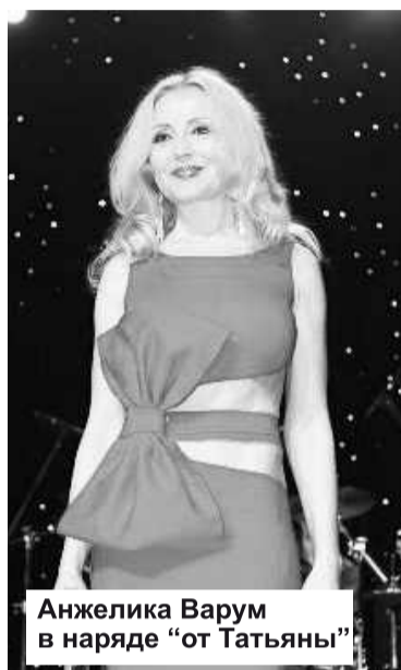
Анжелика Варум в наряде «от Татьяны»