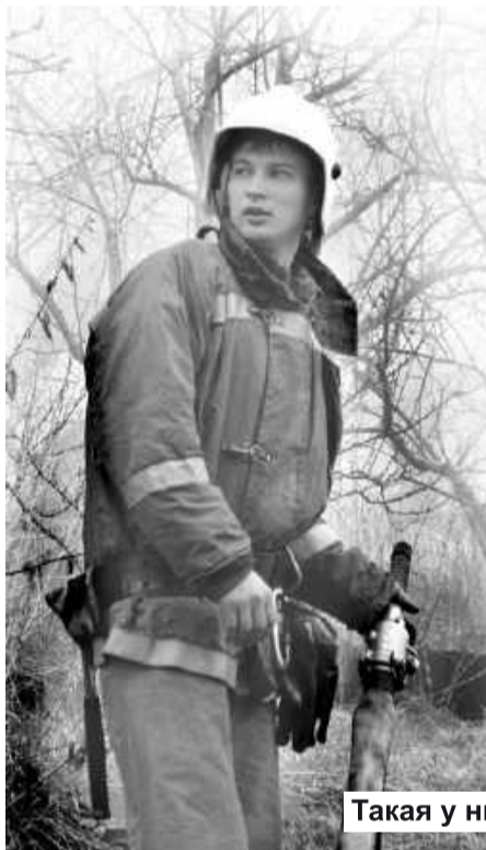
Такая у них работа