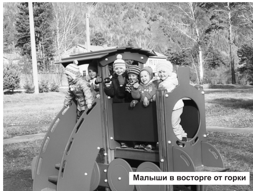
Малыши в восторге от горки