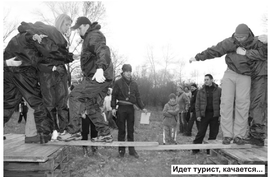
Идет турист, качается...

Все мужественно дошли до финиша. Отличные результаты показала команда «220» СФУ Черемушки. Студенты - единственный коллектив, который одолел