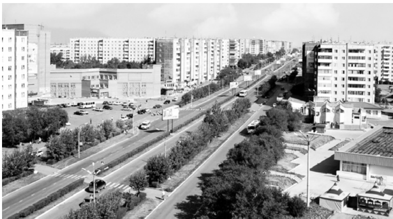
№53 Заводского микрорайона.

Аналогично следует поступить и жильцам, проживающим в доме