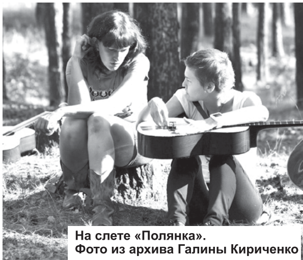
На слете «Полянка».