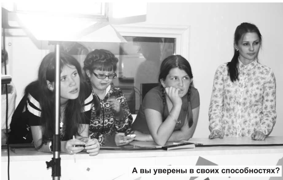
А вы уверены в своих способностях?

И вот долгожданный день настал! Обо всех тонкостях подготовки сюжетов к выпуску в эфир поведала