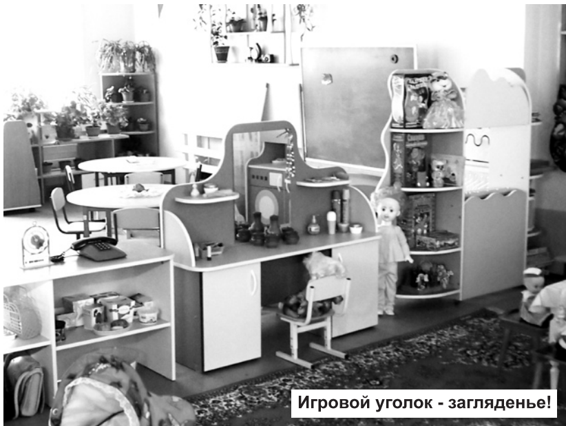
Игровой уголок - загляденье!

ние на уровне руководства компании РусГидро, принявшей решение оказать нам благотворительную помощь. Что мы сделали на эти деньги?