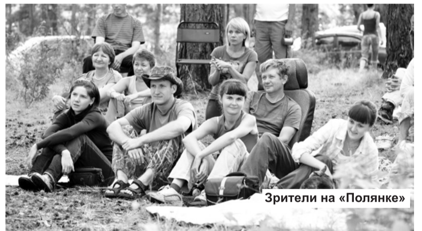
Зрители на «Полянке»

Утро разезда: отчасти ослабленное и умиротворенное, отчасти – хлопотливое и озабоченное. Настроение зависит от того, кого, высунувшись из палатки, увидишь первым. То ли полусонную компанию, которая слегка поредела, но так и не выпустила гитару. То ли Женю-коменданта и его волонтеров, озабоченных наведением чистоты на поляне.