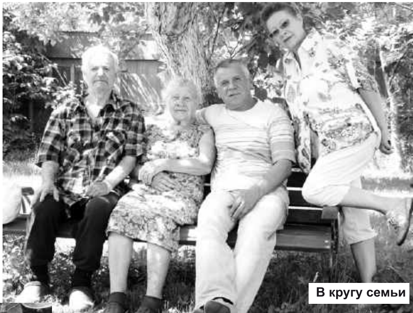
В кругу семьи

Говорят, что многие люди меняются на глазах, когда из простых «работяг» выбиваются в «началь-