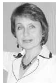
Анализировала Лариса ПРОХОРОВА