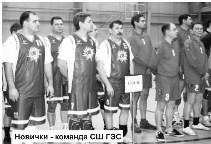
Новички - команда СШ ГЭС