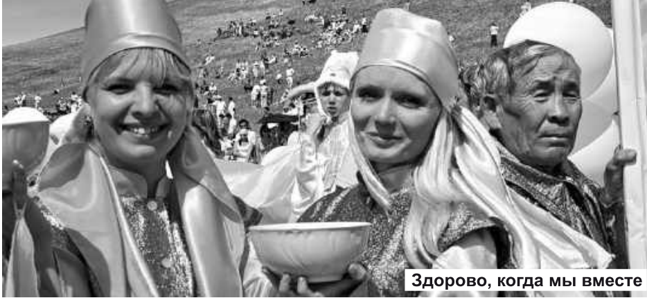
Здорово, когда мы вместе

- Конкретная и острая проблема, с которой в основном сталкивается городское население в российских