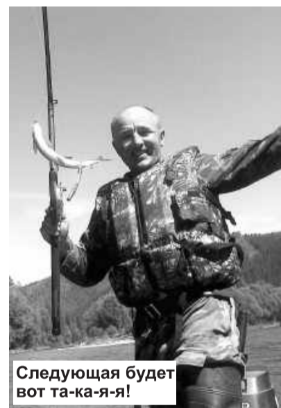
Следующая будет вот та-ка-я!

- А как иначе? Мы – семья. И бизнес стал семейным. В нем участвуют старшая дочь и зять, а уж жене, как говорят, сам Бог