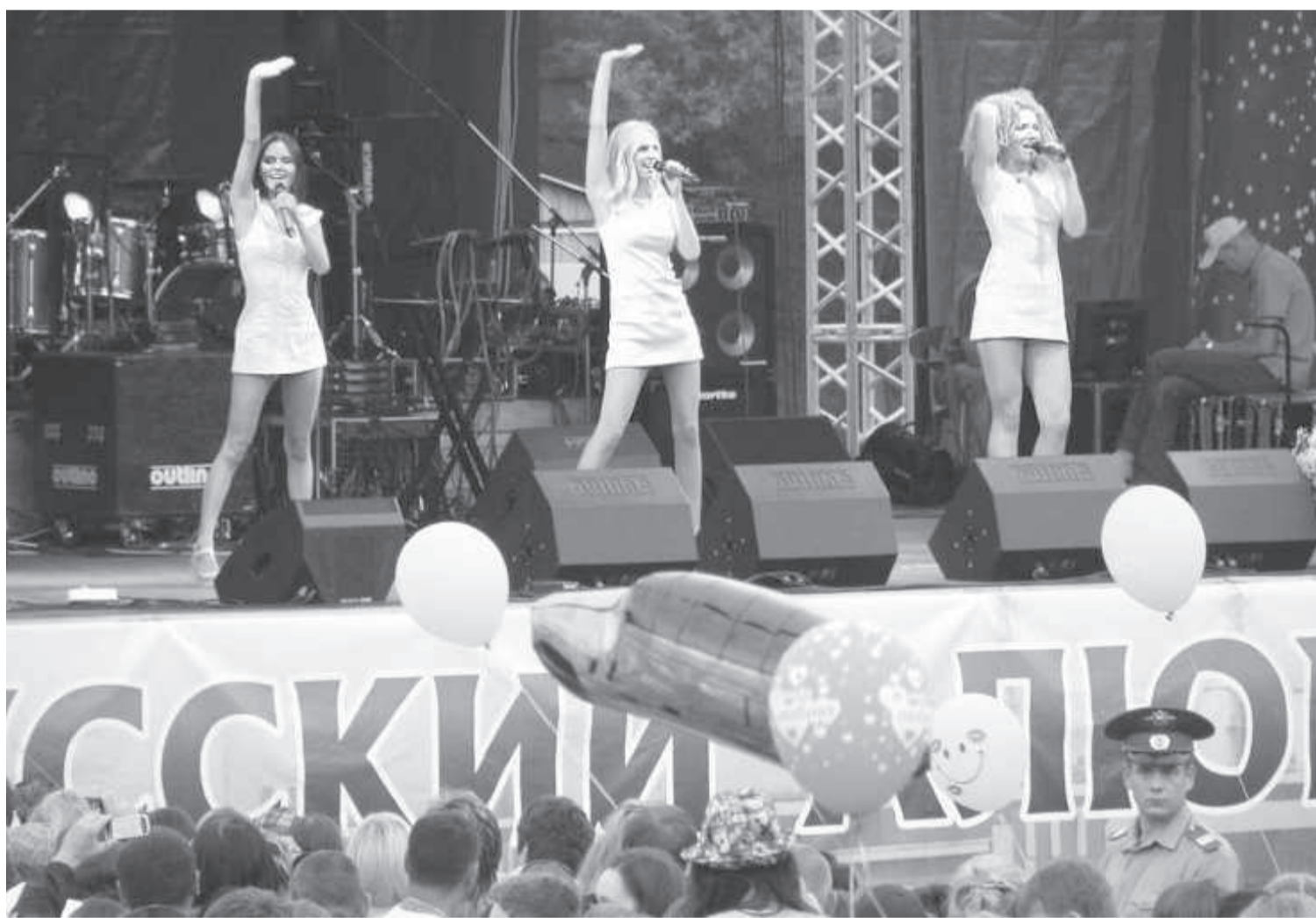
Репортаж с праздника читайте на стр. 5