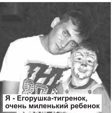
Я - Егорушка-тигренок, очень миленький ребенок