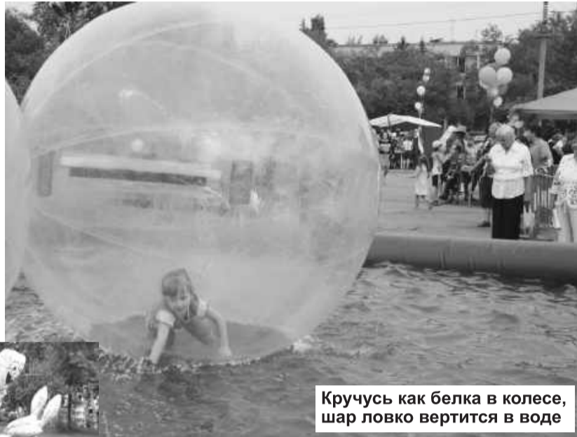
Кручусь как белка в колесе, шар ловко вертится в воде