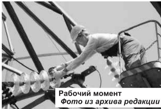
Рабочий момент

Причина случившегося - невыполнение Правил установления охранных зон объектов электросетевого хозяйства и особых условий использования земельных участков, расположенных в границах таких зон. Без разрешения, которое необходимо было получить у владельца линии электропередачи (в данном случае – у Хакасского предприятия МЭС Сибири), в охранной зоне воздушной ЛЭП работники специализированной организации устанавливали деревянную опору на железобетонной приставке для подведения электричества к частному дому. Ее высота составляла 13 метров, а расстояние от земли до провода – 13,2 метра. Несмотря на то, что опора не коснулась провода, произошло перекрытие воздушного промежутка, и электрический ток напряжением 220