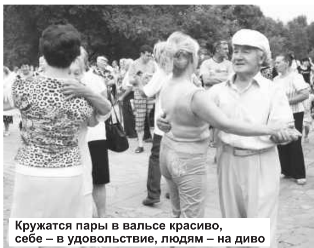
Кружатся пары в вальсе красиво, себе – в удовольствии, людям – на диво