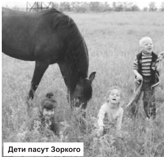
Дети пасут Зоркого