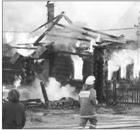
необходимо только под собственным присмотром.

Владельцам автомобилей следует помнить: чтобы не лишиться своего авто в результате возгорания, прогреть его