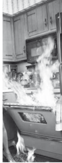
Главное управление МЧС России по Хакасии

- вода для тушения пожара на кухне не годится! Помогут «Пемлокс» и даже земля из цветочных горшков. Цветы, конечно, жалко, но когда дорога каждая секунда, раздумывать нельзя; - не оставляйте готовящуюся еду без присмотра. Если нужно выйти из кухни «на секундочку» - берите с собой ложку. Она напомнит, что вы готовите; - будьте осторожны, когда открываете кастрюлю. Пар из-под крышки может серьезно обжечь; - не пользуйтесь на кухне аэрозолями. Они могут вспыхнуть даже на значительном расстоянии от плиты.