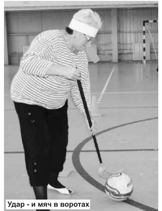
Удар - и мяч в воротах

В результате согласованности действий городской администрации, комитета по делам молодежи, физической культуре и спорту, городского отдела культуры, Управления социальной поддержки населения и Общественной палаты, декадник получился незабываемым. Мероприятия продолжают. Это радует. Значит, у саяногорцев старшего поколения есть темы и поводы направить совместную работу на общине, проведение досуга - на позитив.