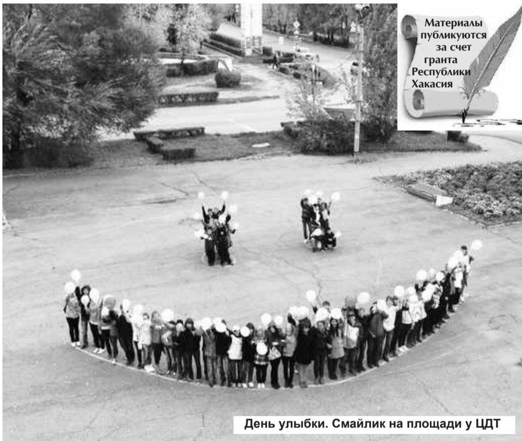
День улыбки. Смайлик на площади у ЦДТ