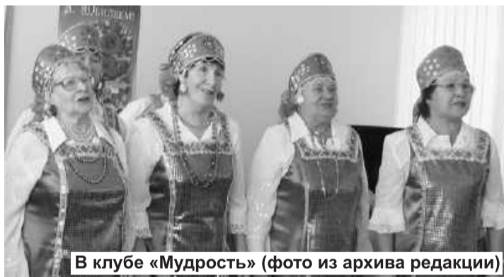
В клубе «Мудрость»

Юбилей члены клубного формирования отмечали широко и весело. В торжестве приняли участие около 40 человек. В адрес юбиляров звучали приветственные речи от представителей городской администрации, Общественной палаты и Управления социальной поддержки населения.