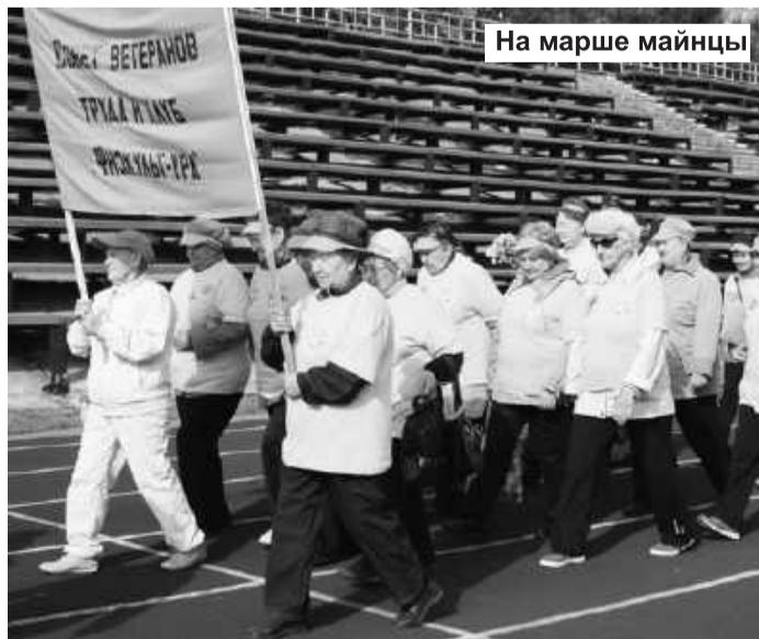
На марше майнцы