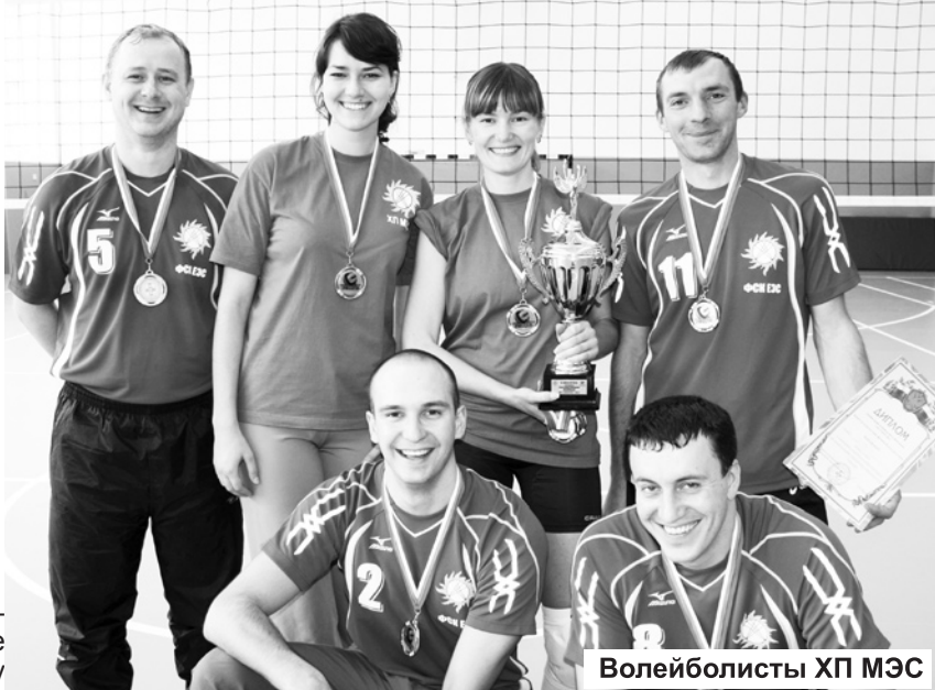
Волейболисты ХП МЭС

«вскипала» вода. Алмазные россыпи брызг осыпали болеющих за тех, кому предстояло проплыть в водной эстафете 25 метров. Блестяще с задачей справились энергетики Лидерами в плавании стали спортсмены Саяно-Шушенской ГЭС. Всего на секунду от них отстали энергетики ХП МЭС. Третьими к финишу пришли пловцы Саяно-Шушенского Гидроэнергоремонта.