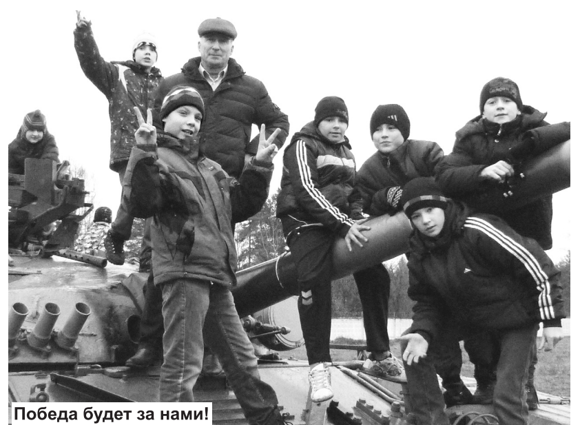
Победа будет за нами!