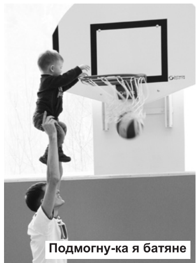
Подмогну-ка я батяне

участие в организации масштабного мероприятия. Огромное спасибо главному его спонсору – компании РусГидро, которая вновь взяла на себя финансирование фестиваля, предоставила площадки для соревнований в прекрасном физкультурно-спортивном комплексе поселка Черемушки. Надеюсь, наше сотрудничество продолжится и будет столь же плодотворно.