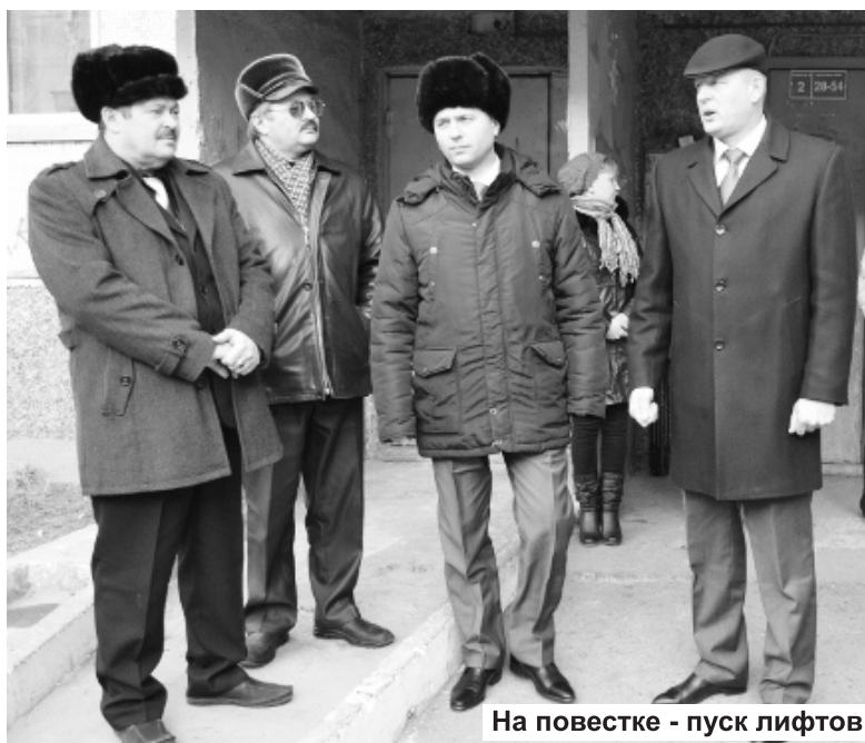
На повестке - пуск лифтов