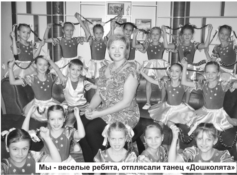
Мы - веселые ребята, отплясали танец «Дошколята»

На суд жюри танцоры представили два номера в разных жанрах: детский танец «Дошколята» и эстрадный «Забав-