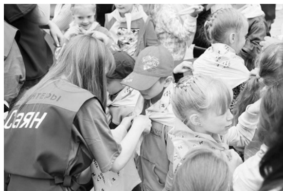
Посвящение в юные экологи