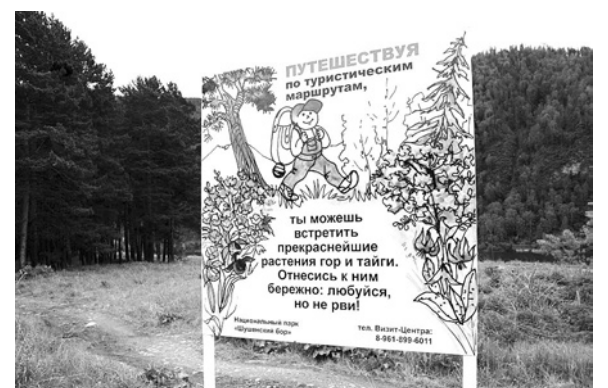
Аншлаг для Шушенского бора