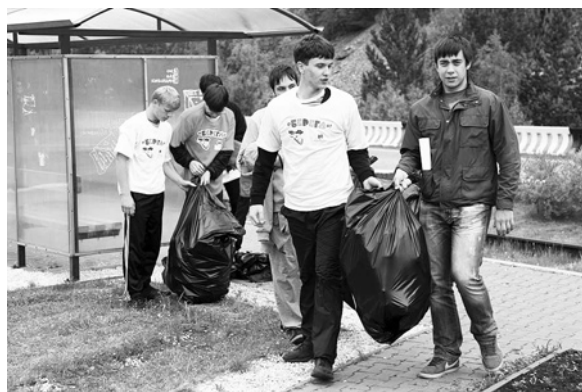
Студенты на уборке территории

Начало июня в Хакасии выдалось очень жарким. А вот прогноз погоды на восьмое июня неутешительный – обещают дождь. Но, как поется в песне: «У природы нет плохой погоды, каждая погода - благодать». И наша сегодняшняя «песня» о том, как в поселке Черемушки проходит традиционная экологическая акция «ОБЕРЕГАЙ».