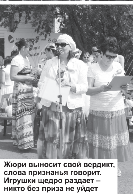
Жюри выносит свой вердикт, слова признанья говорит. Игрушки щедро раздает – никто без приза не уйдет