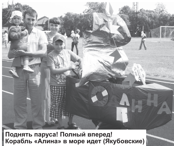
Поднять паруса! Полный вперед! Корабль «Алина» в море идет (Якубовские)