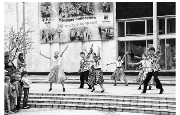
Творческий коллектив ДК «Энергетик»