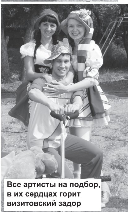
Все артисты на подбор, в их сердцах горит визитовский задор

Факты За пять месяцев 2012 года в городе родилось 378 малышей - 196 мальчиков и 182 девочки. Самые популярные имена новорожденных: Артем, Дмитрий, Егор, Анастасия, Мария и Дарья.