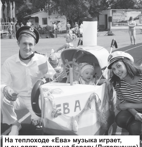
На теплоходе «Ева» музыка играет, и он опять стоит на берегу (Литовченко)