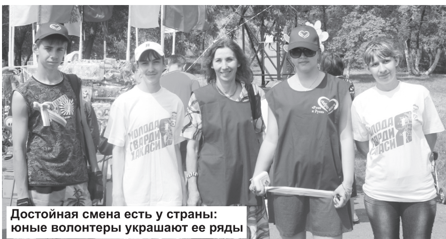
Достойная смена есть у страны: юные волонтеры украшают ее ряды