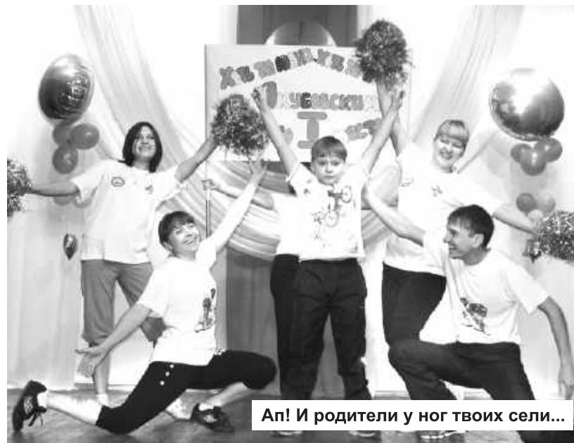
Ап! И родители у ног твоих сели...