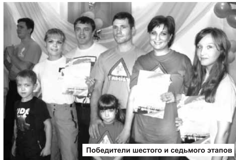
Победители шестого и седьмого этапов