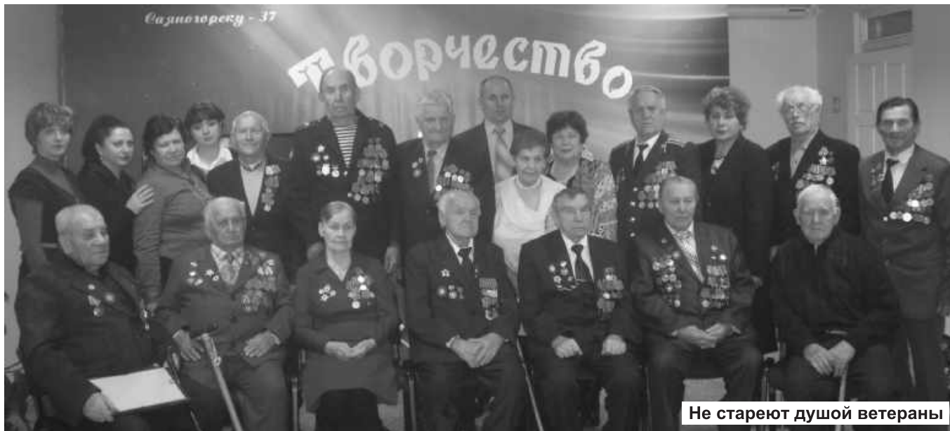
Не стареют душой ветераны

В который раз благодарим сотрудников музея за то, что из года в год приглашают великое поколение защитников Родины в свои гостеприимные стены. Ветеранам Великой Отечественной войны есть что вспомнить, рассказать участникам встречи о своих фронтовых буднях и подвигах, пообщаться с боевыми друзьями-товарищами, а на «посылок» поднять фронтовые сто граммов за тех, кого сегодня не досчитываются в своих мужественных рядах.