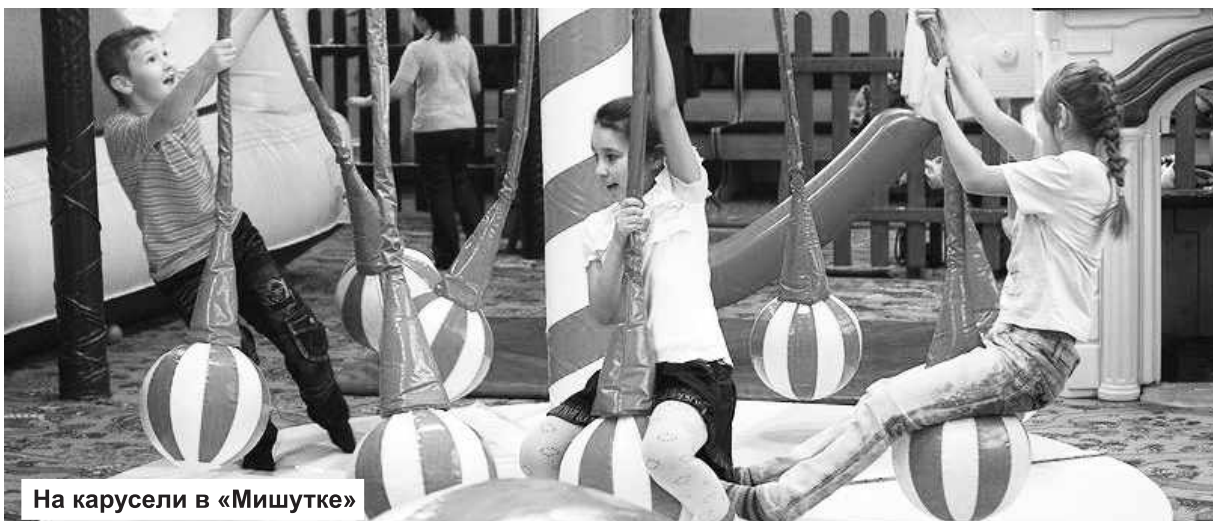
На карусели в «Мишутке»

Энергетики СШ ГЭС подарили воспитанникам абазинского детского дома отдых в столице Хакасии