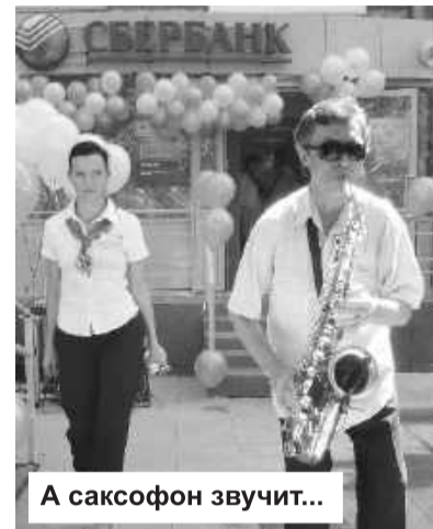
А саксофон звучит...

- Благодарна всем руководителям, которые услышали голос