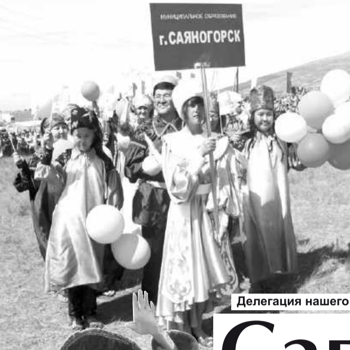
Делегация нашего города