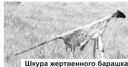
Шкура жертвенного барашка