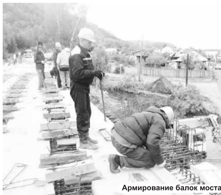
Армирование балок моста

Признаться, мост протяженностью 50 метров, не просто впечатлил – вызвал глубокое уважение к такой силе. Предста-