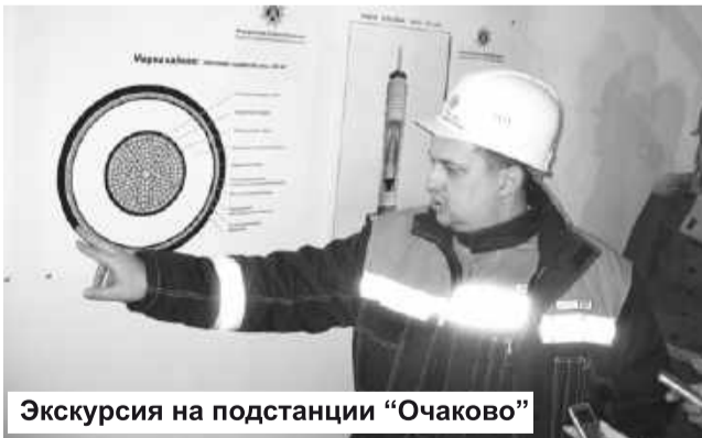
Экскурсия на подстанции «Очаково»

Сейчас, после реконструкции, - это, можно сказать, новый энергосетевой объект, оснащенный современным оборудованием. Самое удивительное в том, что вместо бывших 15-ти гектаров занимаемой площади подстанция располагается всего на 4,5. Это стало возможным благодаря строительству закрытых распределительных устройств с применением оборудования КРУЭ. У них нет электрооборудования под открытым