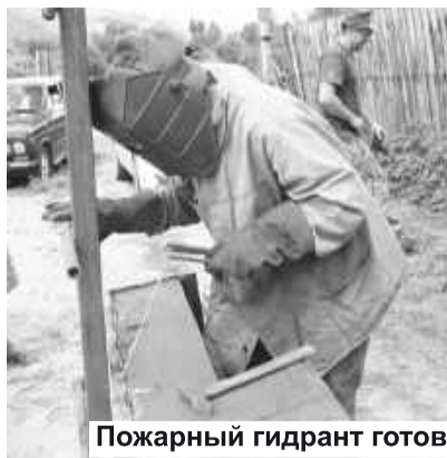
Пожарный гидрант готов

Вернемся к «ветру перемен». Почему назвала его слабым? Потому что большинство дачных обществ оказались Фомами неверующими, отказавшимися участвовать в конкурсе, объясняя свое