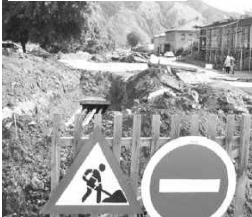
Ремонт коммуникационных сетей в Майне

лению автогрейдер и водовозку. По специальной программе проведен технический аудит тепловых и водопроводных сетей. Их износ составил 58 процентов. Сейчас готовится рассчитанная на три года программа по замене ветхих сетей. Решается и проблема устаревших лифтов. Из 202-х более 40 выработали свой