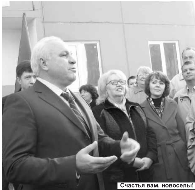
Счастья вам, новоселы!

Единственный подъезд нового дома украшен разноцветными шарами. Над входом плакат: