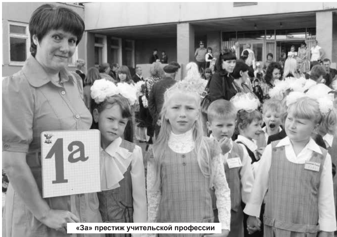
«За» престиж учительской профессии