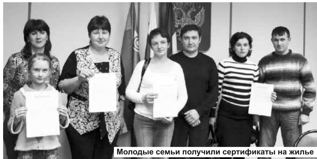
Молодые семьи получили сертификаты на жилье

лению автогрейдер и водовозку. По специальной программе проведен технический аудит тепловых и водопроводных сетей. Их износ составил 58 процентов. Сейчас готовится рассчитанная на три года программа по замене ветхих сетей. Решается и проблема устаревших лифтов. Из 202-х более 40 выработали свой