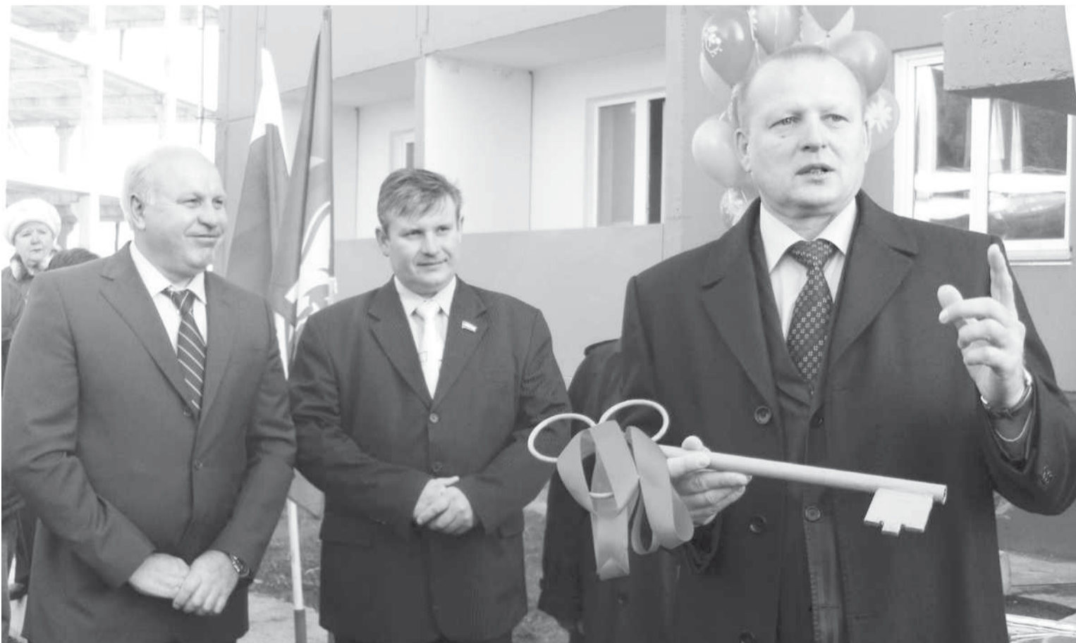
Материал о визите Виктора Зимина читайте на 3 стр.

Глава Республики Хакасия высоко оценил курс городской администрации на развитие муниципального образования и гарантировал помощь в решении проблем