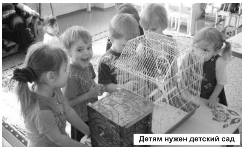
Детям нужен детский сад

Партия «Единая Россия» берет под контроль процесс модернизации в системе образования