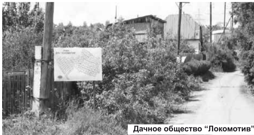
Дачное общество «Локомотив»

ющие при необходимости временное наполнение водой пожарных машин. Все это благодаря средствам, полученным по грантам. У инициатора проекта «Дачи Хакасии» - партии «Единая Россия» - слово не расходится с реальным делом.