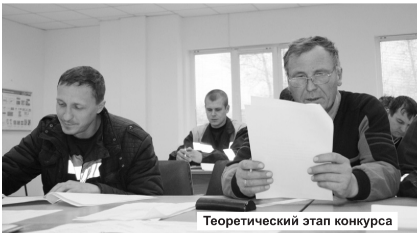
Теоретический этап конкурса

Хакасское предприятие магистральных электрических сетей накануне Дня автомобилиста организовало первый конкурс водительского мастерства