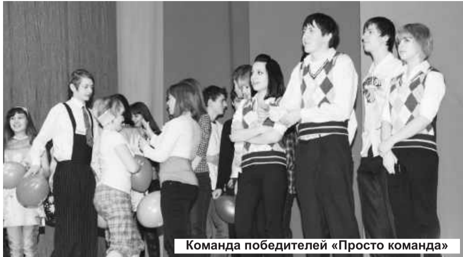
Команда победителей «Просто команда»

В живописном месте Черемушек под стать вздыбившимся отвесной стеной Саянам на противоположном берегу Енисея расположился монолитный красавец ДК «Энергетик». В этот день своим оживлением и эмоциональной суетой он похож на муравейник. По длинным коридорам-лабиринтам снуют туда-сюда молодые люди, заканчивающие последние штрихи перед акцией-игрой «Формула жизни».