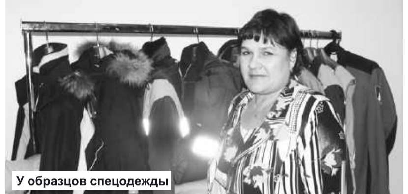
У образцов спецодежды

Участники «круглого стола» пришли к выводу, что только согласованные действия Администрации города и руководителей предприятий обеспечивают снижение травматизма. Чтобы охра-