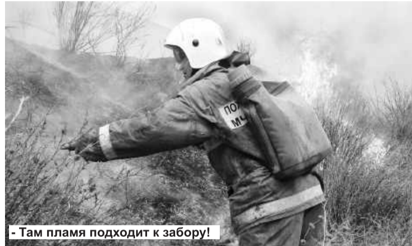
- Там пламя подходит к забору!