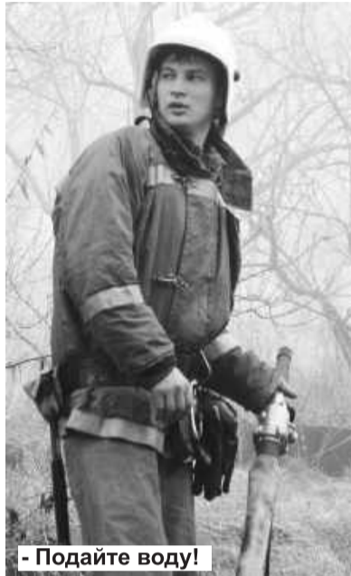
- Подайте воду!