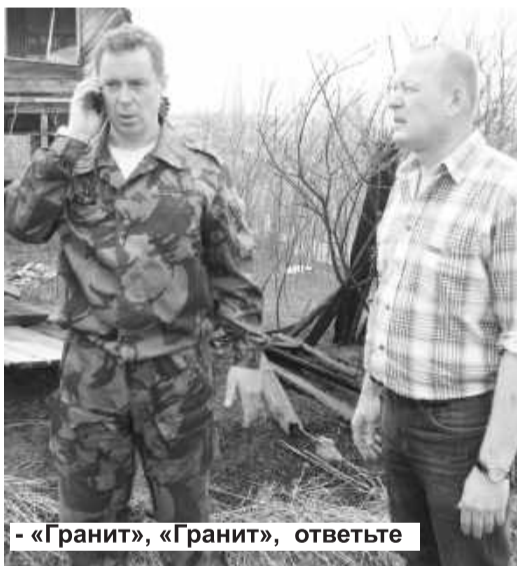
- «Гранит», «Гранит», ответьте

для выполнения должностных обязанностей и пожарных 9 ПЧ.