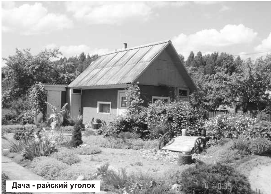
Дача - райский уголок

Первые счастливицы уже начали ремонт своей инфраструктуры, в которую финансы не вкладывались десятилетиями.