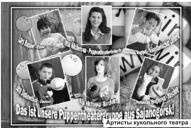
Артисты кукольного театра

Что делать, если там, где ты живешь, никто не говорит по-немецки?