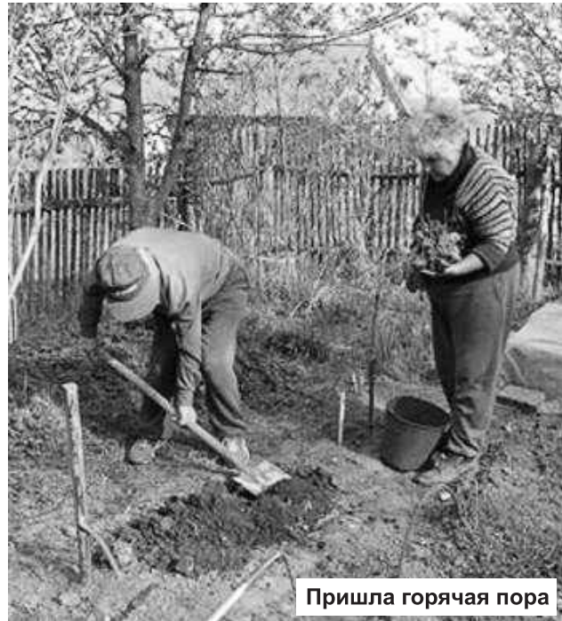
Пришла горячая пора

Люди среднего возраста и молодежь не хотят обрабатывать землю. Поэтому необходимо разработать перечень мотиваций, вызывающих желание и интерес у работоспособных граждан к сельскохозяйственному труду.